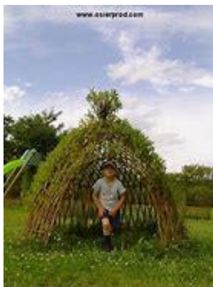
Point 2 Cabane en saule