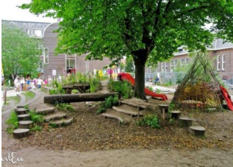
Point 4 Labyrinthe végétal