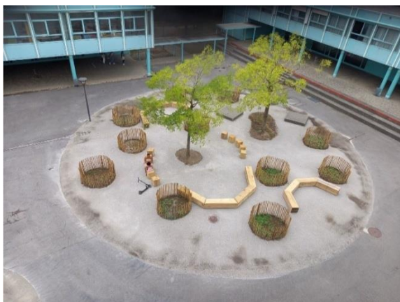
Points 4 et 6 Espace planté d'arbres avec bancs