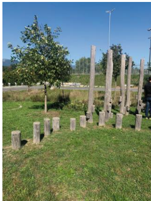
Point 1 Jeu d'équilibre en bois