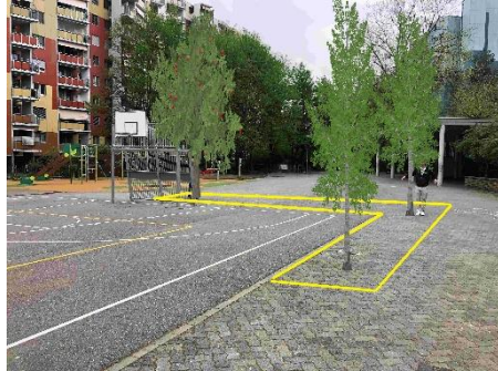
Point 5 Espace planté d'arbres avec bancs