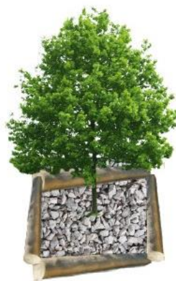
Point 5 Zone graviers ou copeaux