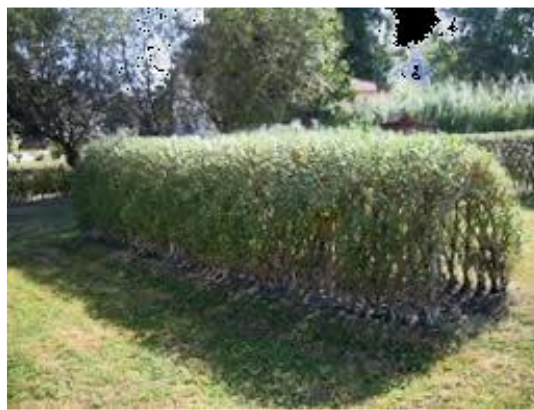
Point 3 Tunnel en saule