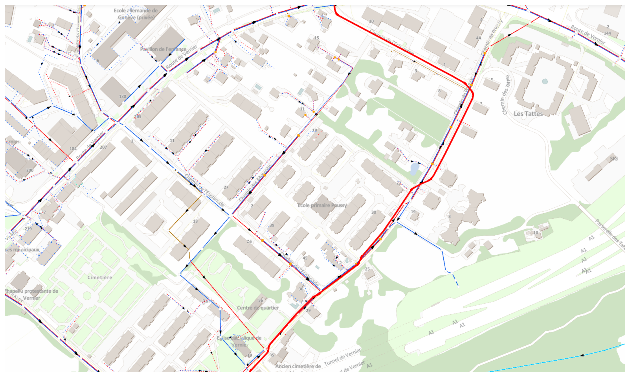
Figure 1 : tracé de la conduite Gaznat (tracé en gras rouge)

La société GAZNAT SA exploite une canalisation de transport de gaz à haute pression, qui traverse le territoire communal du Lignon à la zone industrielle des Batailles, en passant par le Bois des Frères, le chemin de Poussy, de l'Écharpine et la route du Nant-d'Avril. Un projet de remplacement et de sécurisation du tronçon de la conduite de transport de gaz situé sous les chemins de Poussy et de l'Écharpine est prévu à court terme. Ce tronçon est représenté par le tracé en rouge sur la figure 1 ci-dessous.