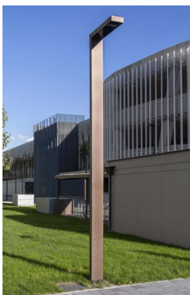
Figure 4 : modèle EWO FA770

Aussi, il est déjà intégré à la présente délibération le remplacement des candélabres trop énergivores (principalement ceux situés sur des poteaux en bois) par de nouveaux mâts d'éclairage de type EWO FA 770, conformément aux modèles disposés sur la Commune lors des derniers travaux de réaménagement routiers.