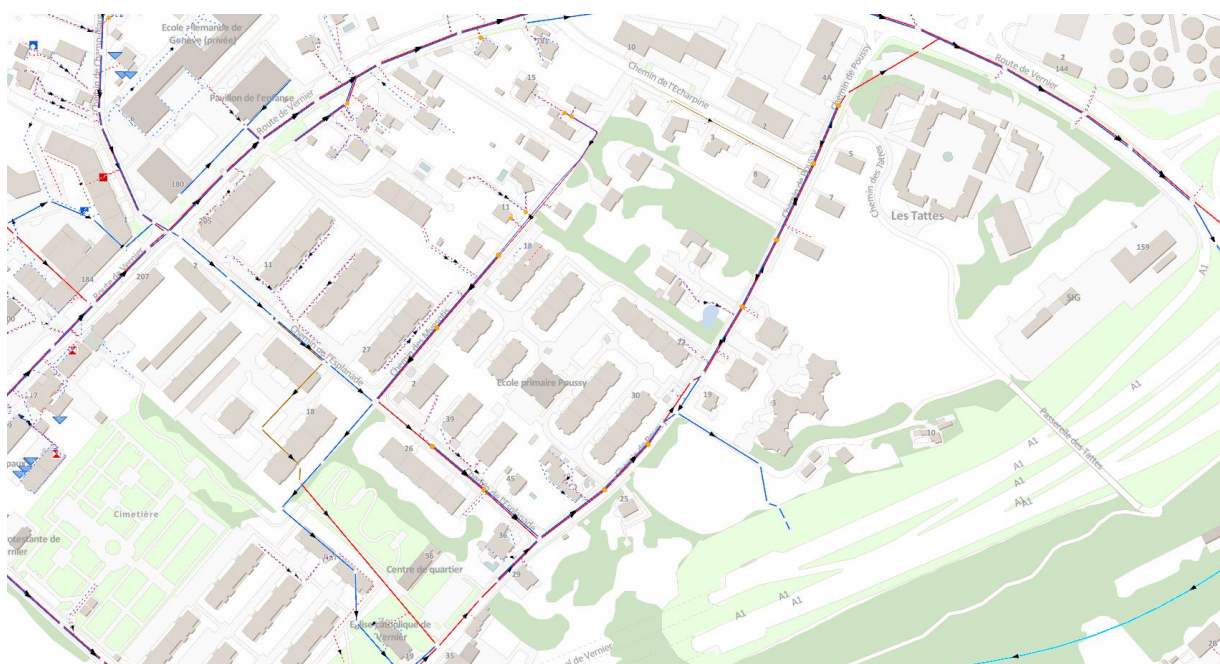
Figure 3 : état du réseau d'assainissement dans le secteur Poussy / Écharpine

Le réseau actuel de collecte des eaux de chaussée se trouve dans l'emprise des travaux nécessaires au remplacement de la canalisation de gaz, ce qui impliquera sa démolition et son renouvellement. En outre, le tracé de ce réseau traversant les parcelles privées situées entre le chemin de l'Écharpine et la route de Vernier n'est pas compatible avec un transfert au réseau d'assainissement secondaire permettant l'évacuation des eaux des biens-fonds privés et son financement par le Fonds intercommunal d'assainissement (FIA).