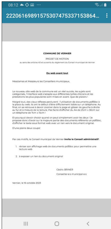
Figure 2: lecture pdf en portrait

Malgré tout, des vieux réflexes perdurent : l'utilisation de documents pdf/doc à la place du web . Ils ont le défaut d'être difficilement lisibles sur un téléphone. Au final, on se retrouve à devoir retourner son écran ou à zoomer dans la page et glisser de gauche à droite au fur et à mesure de la lecture. Pas facile d'afficher du A4 de 21cm x 30cm sur un téléphone de 7cm x 15cm !