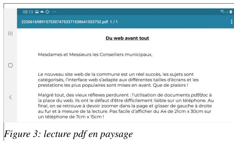
Figure 3: lecture pdf en paysage