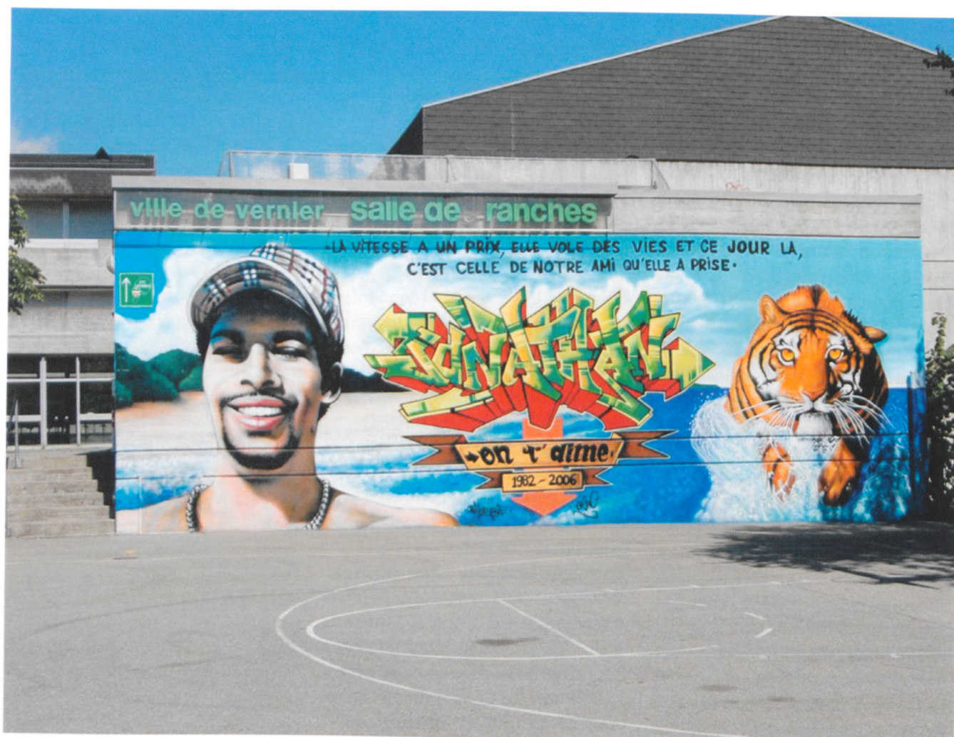
Le but de cette fresque est de faire passer un message de prévention.

La demande avait été faite par sa mère, soutenue dans sa démarche par plus d'une centaine de jeunes. Son but est ainsi de faire passer un message de prévention.