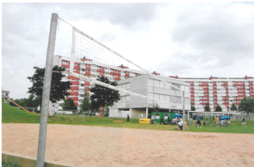
Activités sportives et ludiques au pied des immeubles des Libellules. Un petit paradis pour ses habitants.

"Nous ne sommes pas là pour se faire du fric", explique l'un des bénévoles. Il faut dire que les prix sont du genre symbolique... Un franc cinquante la