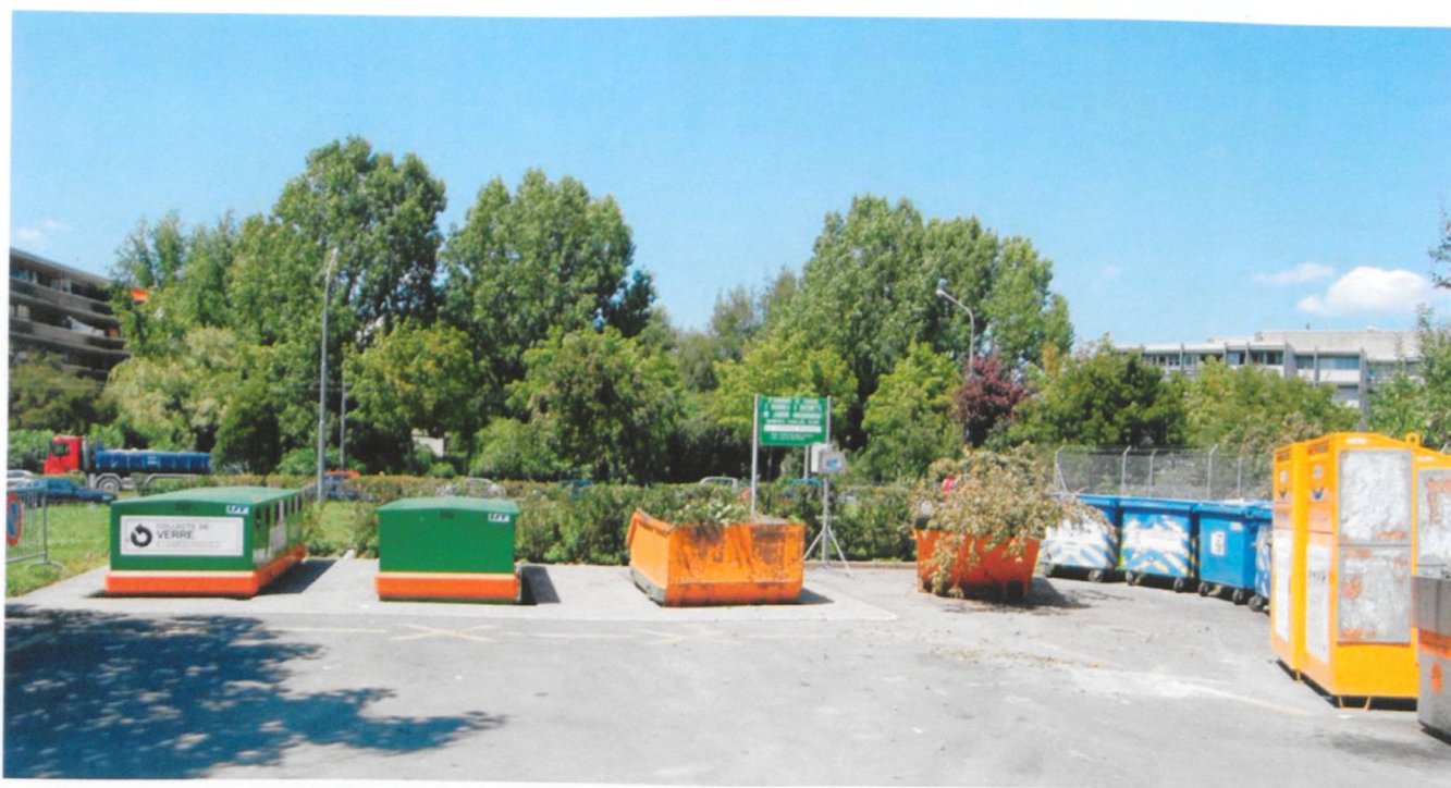
Un projet est à l'étude pour remplacer les actuelles déchetteries par des déchetteries enterrées, ceci à la fois à des fins esthétiques et hygiéniques.

«Le tonnage annuel des ordures ménagères ne cesse de diminuer depuis 2000, date de la mise en place d'une équipe de tri des déchets. Ceux-ci sont passés de 8'623 tonnes (soit 295 kilos par habitant) à 7'974 tonnes l'an dernier (soit 251 kilos par habitant). Dans le même temps, le tonnage de déchets valorisables a augmenté de près de 1270 tonnes. Un exemple : l'équipe de quatre personnes en charge du tri a réussi à séparer toujours davantage de bois des déchets finissant par être brûlés à l'usine d'incinération des déchets des Cheneviers (ndlr. ce qui coûte cher à Vernier). En 2006, 557 tonnes de bois ont été triées (+148 tonnes par rapport à 2005). En conséquence de quoi, le pourcentage de déchets valorisables à Vernier est désormais de 36,4%. On s'approche de l'objectif de 40% fixé par les autorités cantonales.» Parallèlement, au tri des déchets encombrants, le service de la récupération a mené en 2006 un certain nombre d'actions : ■ Pose d'un nouvel autocollant pour les containers de déchets compostables, plus visible et plus explicite ;