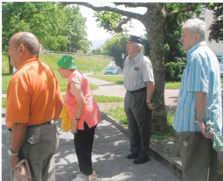
Concentration de rigueur pour les adeptes de la boule ferrée