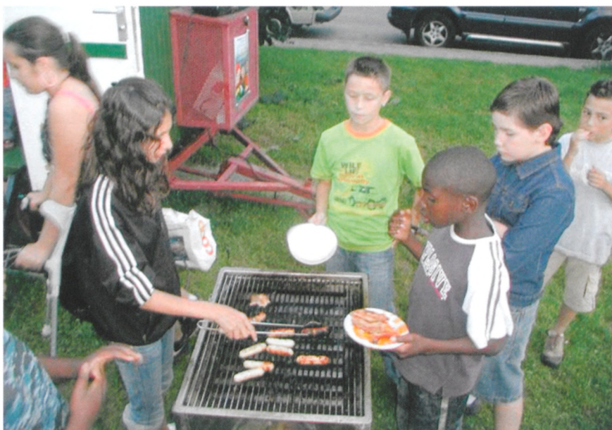
En juillet, les activités ont connu un franc succès et le grill a permis à beaucoup de partager un repas convivial

Afin de continuer l'aventure avant la rentrée, venez nous retrouver du lundi au jeudi de 14h à 20h et le vendredi de