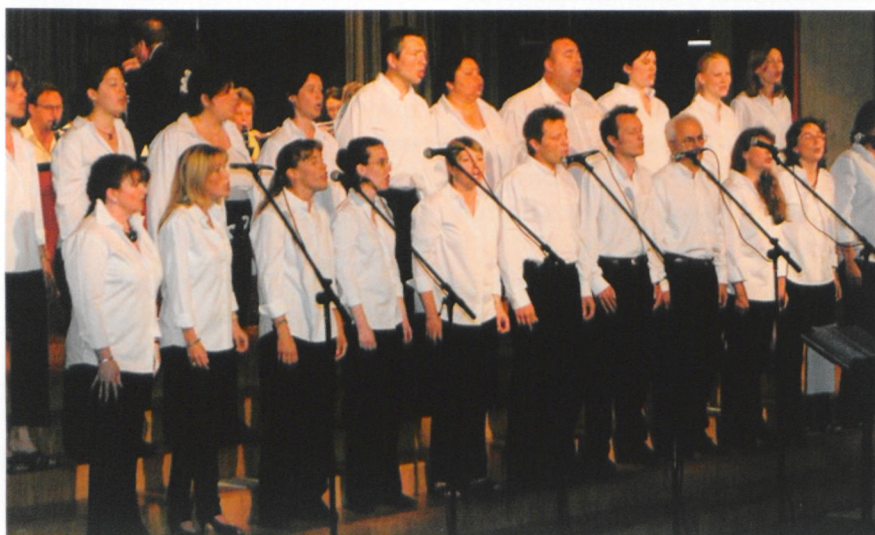
La Fanfare municipale a invité le groupe Ten Sing Genève