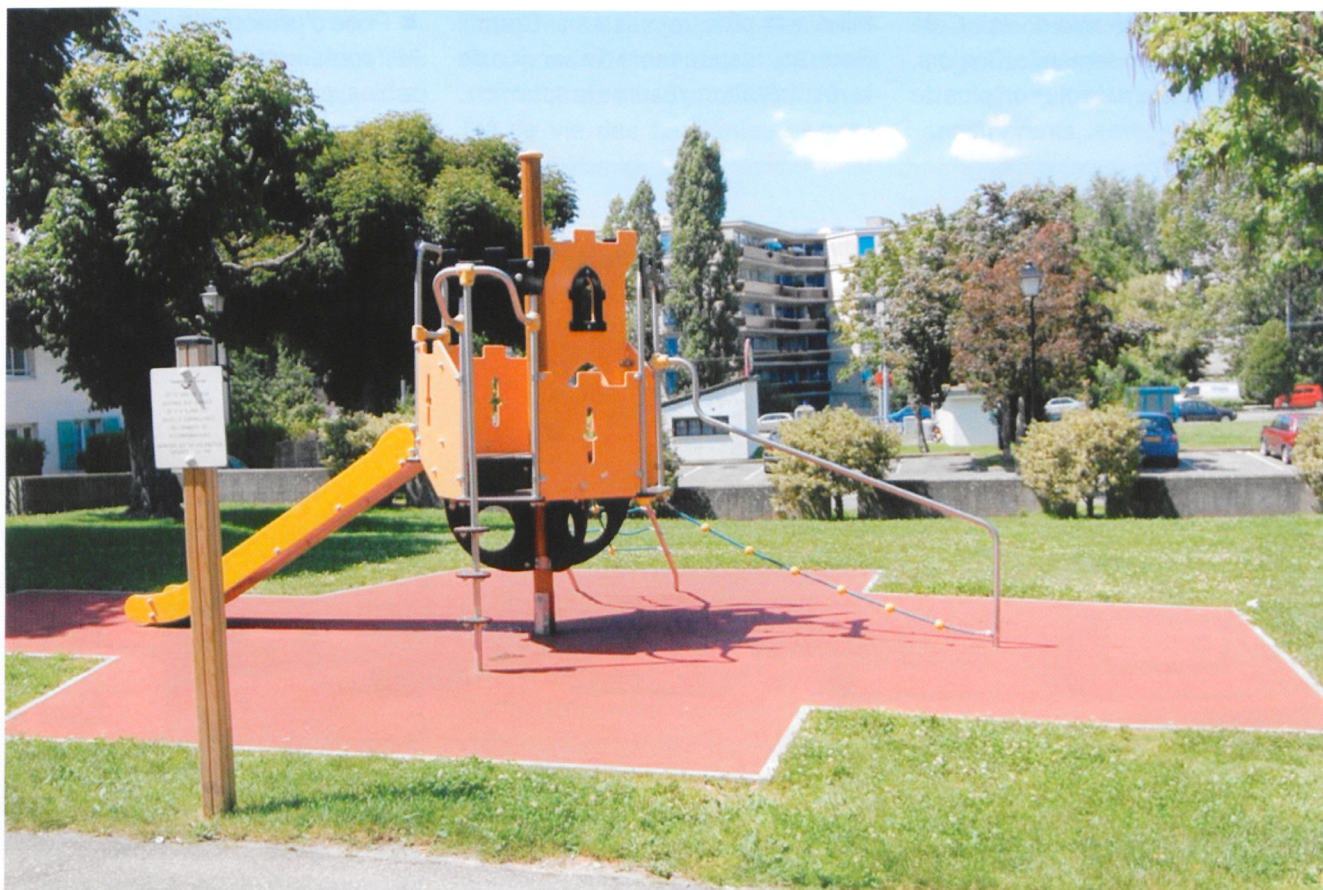
Les balayeurs s'occupent également du nettoyage des places de jeux dans les écoles.

Vernier est doté de trois équipes de trois balayeurs, soit 9 balayeurs en tout. A cet effectif s'ajoute un collaborateur se consacrant uniquement à vider les corbeilles en question. La troisième équipe a été recrutée voici