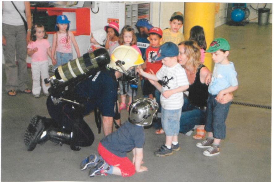
Les petits ont découvert en détail l'équipement vestimentaire ainsi que tous les accessoires des pompiers

Un à un, les enfants ont pu monter à l'intérieur du camion et faire une brève