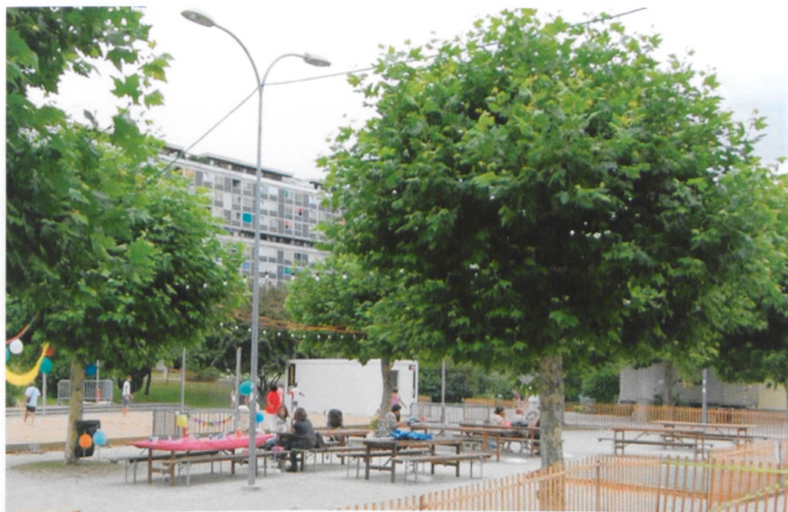
Au Lignon, le terrain de beach-volley est même occupé la journée lorsque le filet n'est pas encore installé.

Du côté du Lignon, il est également possible de pratiquer le volley-ball sur le sable. Là aussi une équipe de bénévoles se charge d'animer des joutes endiablées entre jeunes et moins jeunes du quartier. Pour le reste, si la cité du Lignon semble un peu plus pauvre en matière d'aménagements sportifs provisoires, c'est que c'est surtout du côté des Libellules que le besoin d'animation était le plus fort. "Ici, nous n'avons pas de centre commercial, ni de salle des fêtes", regrette une bénévole.