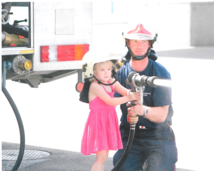
Chaque enfant a pu jouer le rôle d'un petit pompier en exercice.