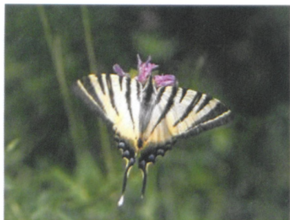
Parmi les papillons : le flambé

voie d'extinction en Suisse y est présente. Un exemple : la présence de 14 sortes d'orchidées. Or, avec toutes ses fleurs, on trouve forcément les animaux qui vont avec, notamment les papillons.