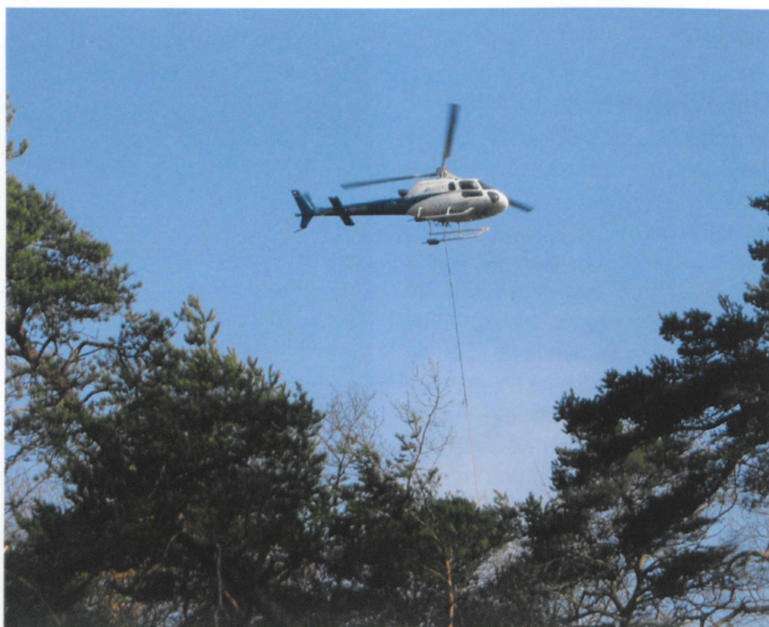
Pour effectuer les travaux, en 2003, la commune a eu recours à un hélicoptère.

Il fallait trancher entre la manière héliportée ou la création d'un téléphérique forestier. La solution héliportée est nettement moins polluante et de surcroît, c'est aussi la plus économique.