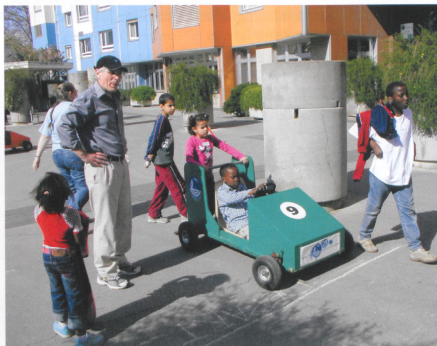
Enfants et adultes se sont égaillés en sillonnant les Avanchets avec leurs drôles de machines.