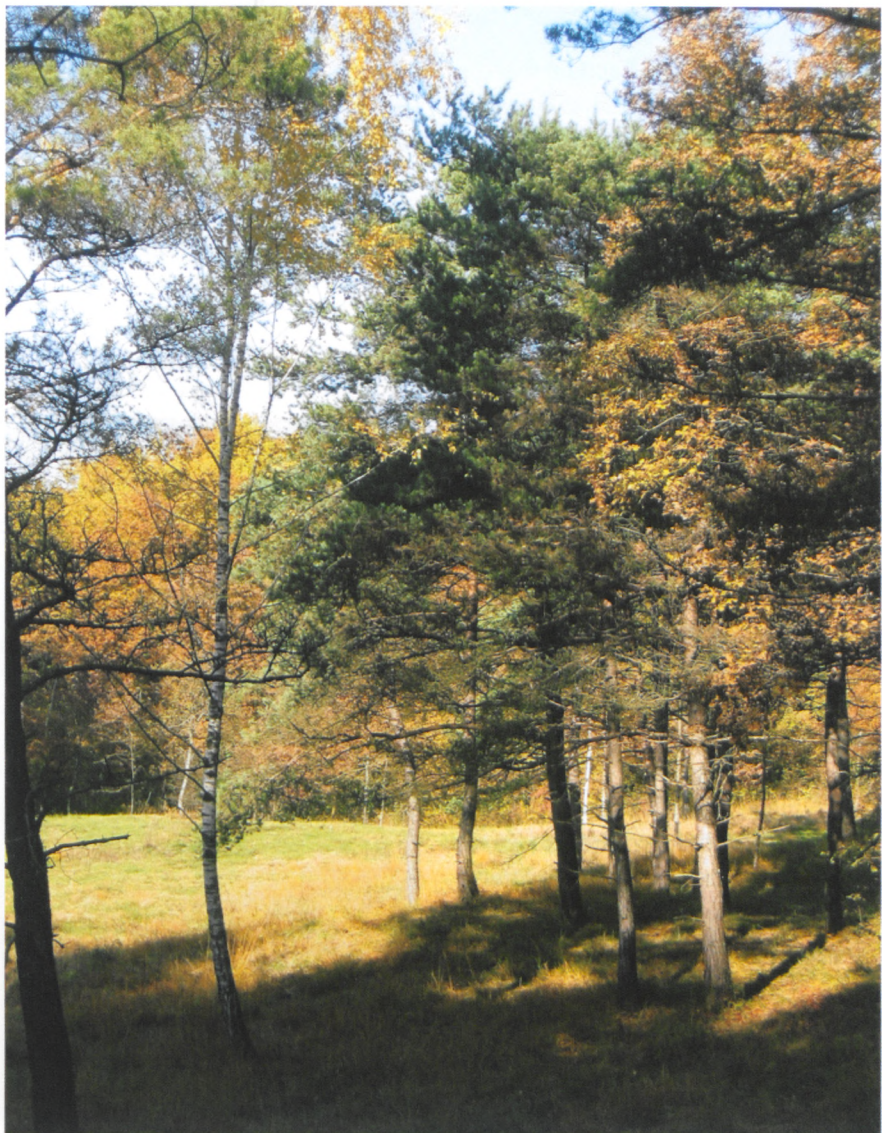
La grande richesse de ce bois, c'est sa prairie.

«La grande richesse de ce bois, c'est sa prairie.» Les deux prés de cette forêt sont riches en brome dressé, une graminée caractéristique des prés secs. Cette particularité a pour corollaire une richesse floristique remarquable. Une dizaine de plantes en