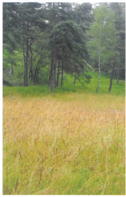
Le Brome dressé, présent dans le bois

Des interventions courantes sont également réalisées : le nettoyage deux fois par année du bois ou encore la fauche des prairies. En respectant une alternance de zones car si le sol est trop riche, cela sera au détriment des fleurs rares. La fauche a lieu tous les trois ans et l'herbe est évacuée. Par le biais d'un chantier d'utilité collectif en collaboration avec le Service jeunesse, emploi et vie sociale.