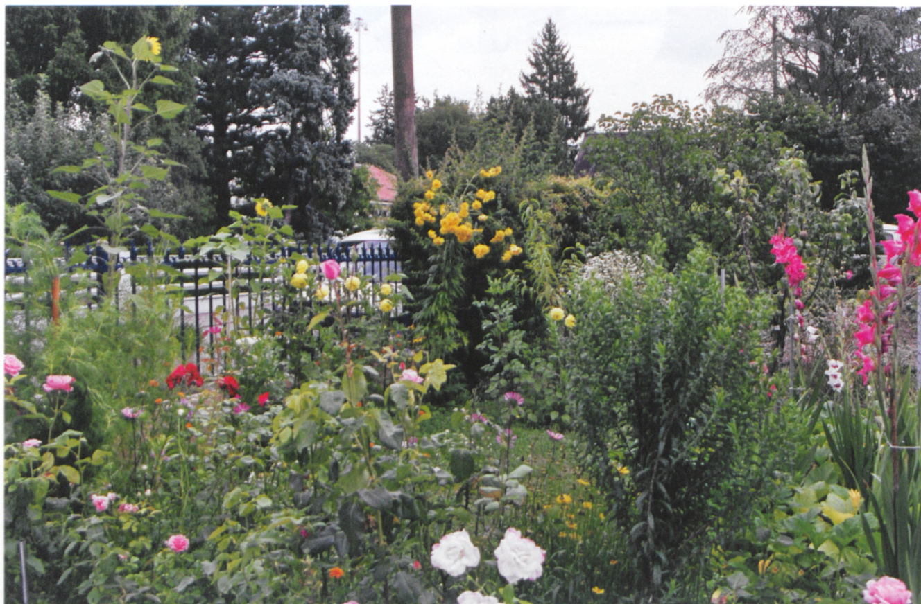
Les passionnés des fleurs nous émerveillent toute la saison