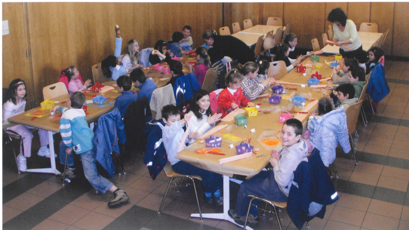
Les matinées bricolages de l'APEVV sont toutes complètes

Dans l'Actualités-Vernier de décembre 2006, un article relatait une enquête pour connaître les besoins des petits Verniolans, âgés de 4 à 10 ans, habitant Vernier-Village.