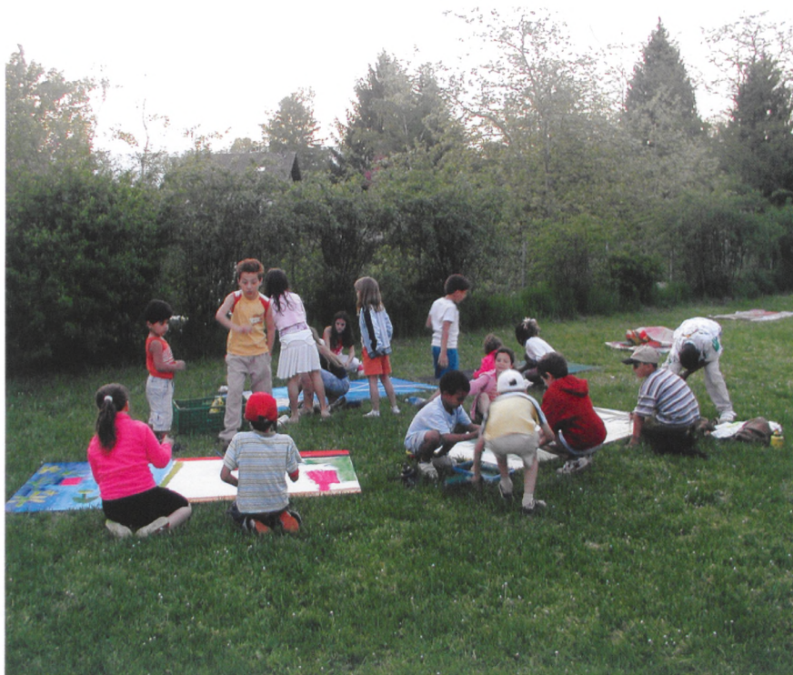
Les enfants ont participé à un atelier peinture en plein air

tants. Un conteur a su enchainer petits et grands. Des musiques d'ici et d'ailleurs ont comblé les oreilles de chacun. La cérémonie africaine du café a permis de rêver et voyager.