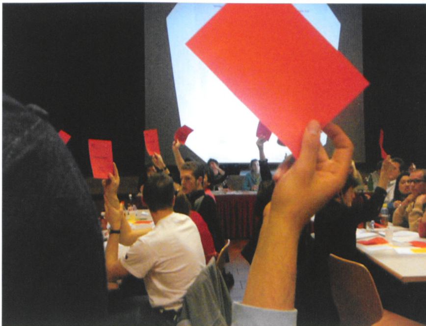
Séance de vote à Spiez (Berne) pendant l'Assemblée générale des parlements de jeunes. 1er avril 2007.