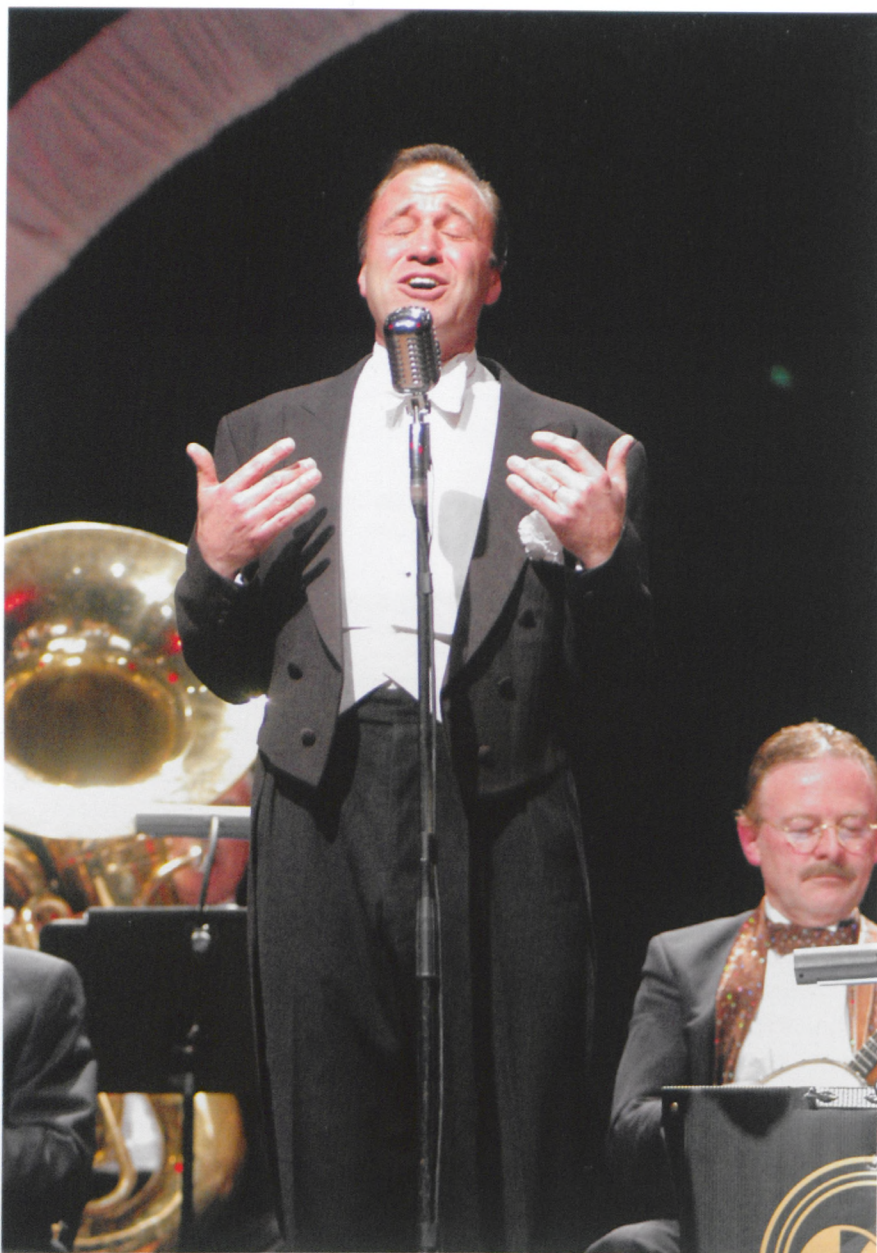
Soirées Jazz de février 2006: quand la salle des fêtes prend un air de Cotton Club

Le Théâtre Bienne Soleure, renommé outre-Sarine, produit plusieurs oeuvres