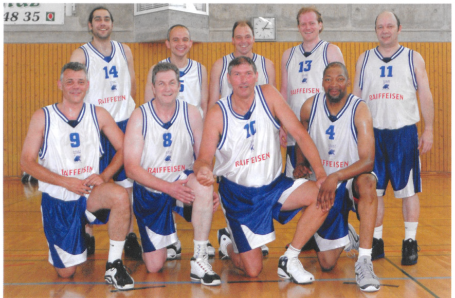
Versoix a gagné la finale pour la 5e fois.

Cette année, pas moins de 18 équipes étaient présentes dont 4 féminines (ou mixtes). Notre canton était très bien représenté avec 15 équipes évoluant soit dans le cadre de l'ACGBA (Association Cantonale Genevoise de Basket-ball Amateur) ou encore dans le GAB (Groupement Autonome de Basket-ball). Au niveau des équipes étrangères, nous avons eu le bonheur de retrouver 2 équipes françaises (Gre-