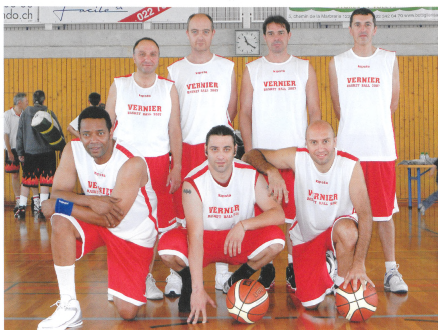
Grenoble (ci-dessus) s'est classé 2e et Grand-Saconnex (ci-dessous) en 3e position.