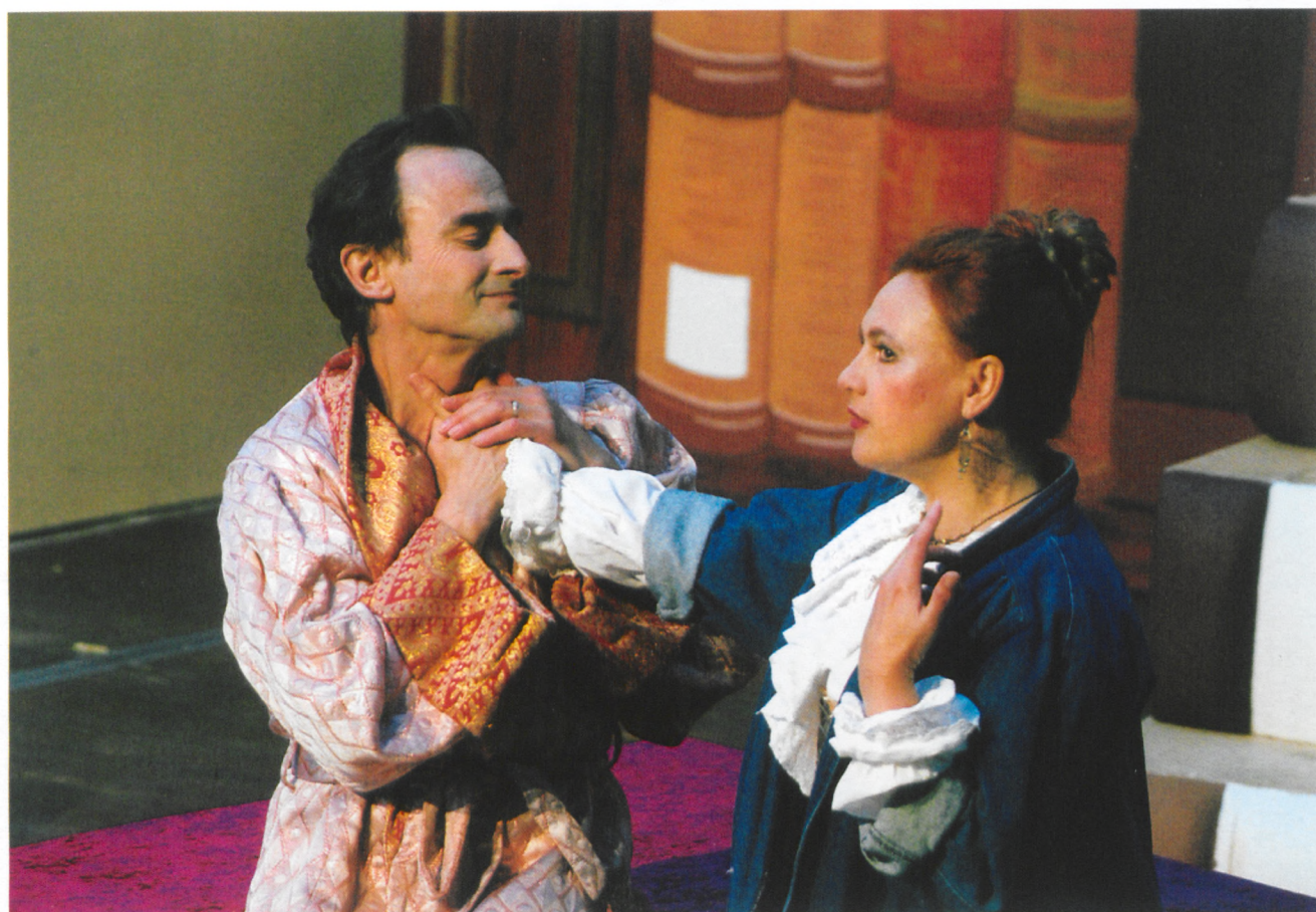
Été 2005: Le parc Chauvet-Lullin a pris des airs frivoles avec Le Libertin d'Eric-Emmanuel Schmitt

Le service de la culture organise de très nombreux spectacles, à commencer par le théâtre d'été en plein air. Comment s'y prend-il ? Comment fait-il ? Quels sont ses choix ? Notre dossier.