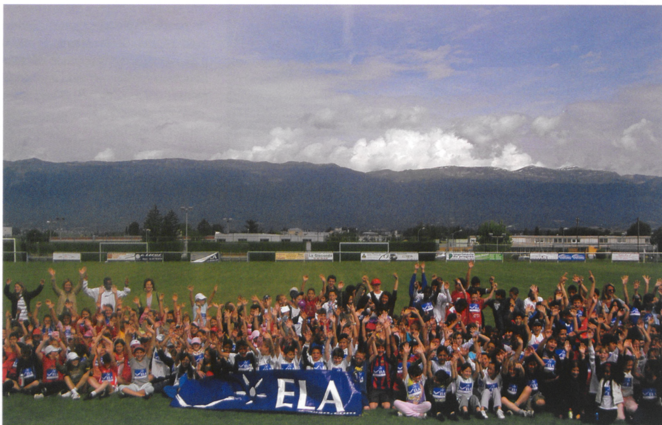
Les 250 élèves des classes de 3P à 6P de l'école des Ranches II ont couru pour l'association Ela au stade de Vernier

La mairie de Vernier a aimablement pris en charge les frais d'une collation pour les enfants et les enseignants.