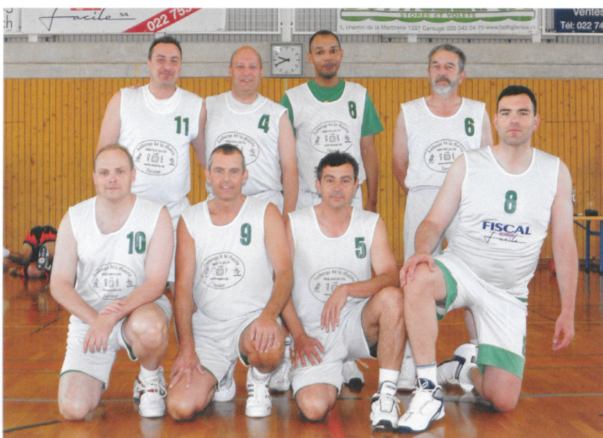
L'E.S. Vernier a organisé cette édition du tournoi mixte international vétérans.

Quant aux 4 équipes féminines, elles ont fait un championnat entre elles et