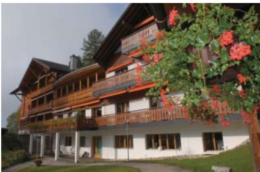
Le chalet Florimont accueille les personnes âgées à Gryon.

Les prestations fournies par les professionnels de l'aide à domicile comportent principalement les soins corporels de base, les soins infirmiers, l'entretien du ménage et du linge. Il y a également la possibilité de faire appel à une ergothérapeute s'il faut par exemple adapter le lieu de vie (installer une poignée dans la baignoire, un flash lumineux pour la sonnette ou le téléphone par exemple).