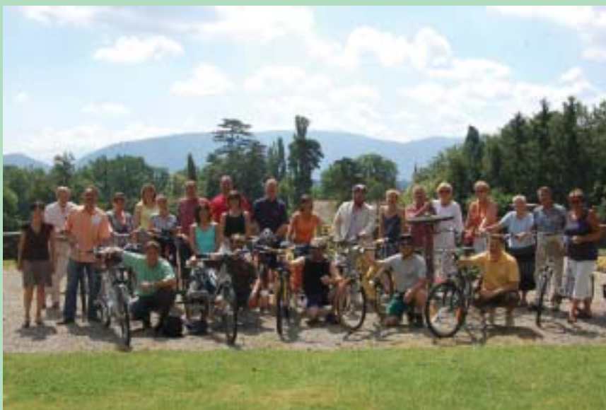
Le Conseil administratif et les employés communaux ayant participé à l'opération «bike to work»

Le second étage de la fusée ? «Une analyse a été lancée à fin juin avec Mobilidée concernant les divers déplacements de nos employés (ndlr. comme les SIG et les HUG l'ont déjà fait). Le but est de mettre en place les moyens de transport les plus rationnels. Il est trop tôt pour savoir quelles mesures seront prises. Nous avons aussi la volonté d'analyser notre parc de véhicules professionnels.»