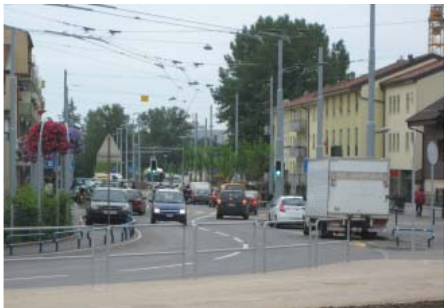
Après la route de Vernier, les Autorités projettent la valorisation de la rue du Village

La commune dispose heureusement de compétences plus étendues pour les axes communaux. Voici une série