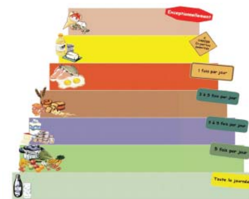
Périodicité de consommation des aliments

Le but de cette brochure est de donner aux parents quelques idées pour trouver un équilibre entre la réalité quotidienne et l'équilibre alimentaire. Que l'enfant ait une prédisposition à ne pas aimer les légumes est une rumeur... Manger est amusant si on y ajoute une part créative et colorée. Par exemple ; servir les légumes de toutes les couleurs et sous toutes les