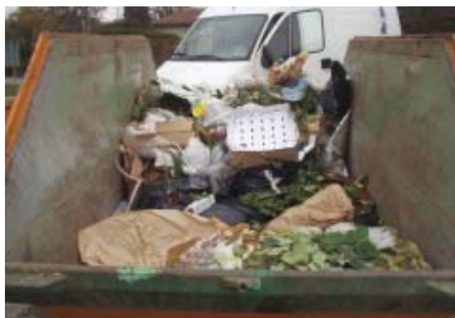
Ordures déposées dans les bennes de déchets compostables

Comme la loi le permet, les amendes peuvent aller de CHF 100.-- à CHF 60'000.--.