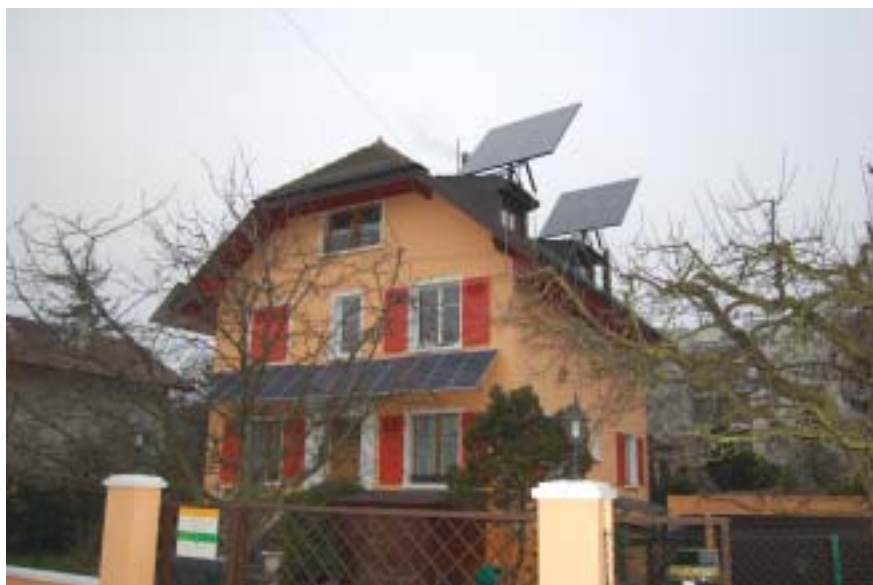
A l'avenir, les toits des maisons de la commune ressembleront peut-être à celui-ci.

Le projet est audacieux. Déposée par les élus du Mouvement citoyen genevois et ceux de l'Union démocratique du centre, la motion M 083-07.12 intitulée "les énergies renouvelables peuvent-elles remplacer les non-renouvelables" vise ni plus ni moins à installer sur tous les toits des bâtiments de la commune des panneaux solaires. But de l'opération: produire notamment de l'eau chaude pour chaque construction grâce aux rayons du soleil et aussi économiser et recycler l'énergie. Si l'initiative a fait l'unanimité, elle n'a pas manqué de provoquer le débat, mais dans un très bon climat.