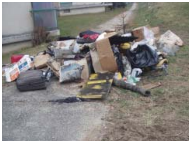
Décharge illécite: encombrants déposés hors des dates fixées

les lundis, mercredis et vendredis. Les sacs peuvent être sortis la veille au soir ou le matin avant 7h00.