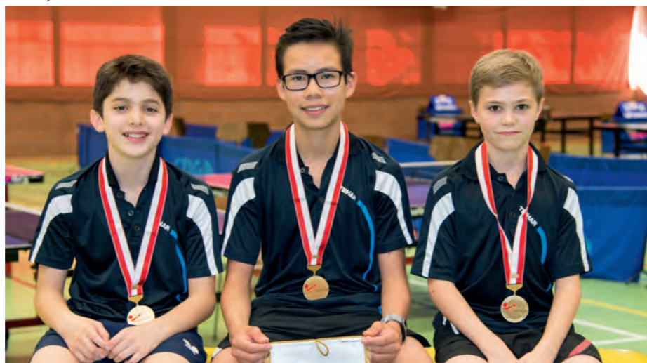
L'équipe U13 du CTT Châtelaine.