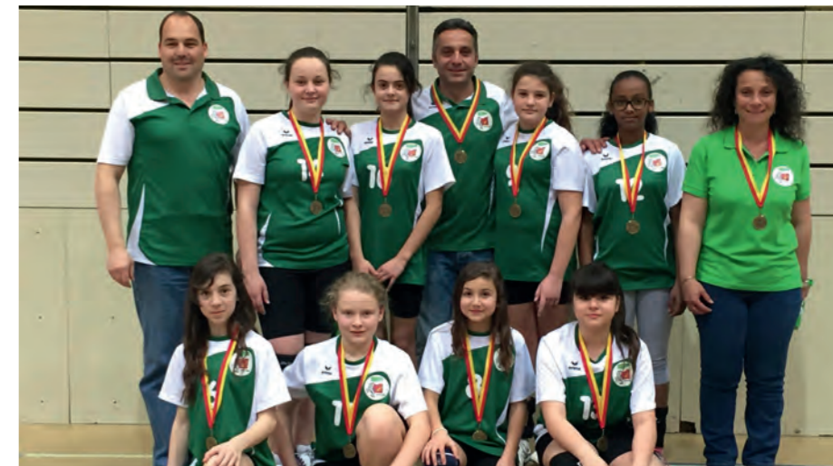
L'équipe U13, 3 e du championnat genevois.