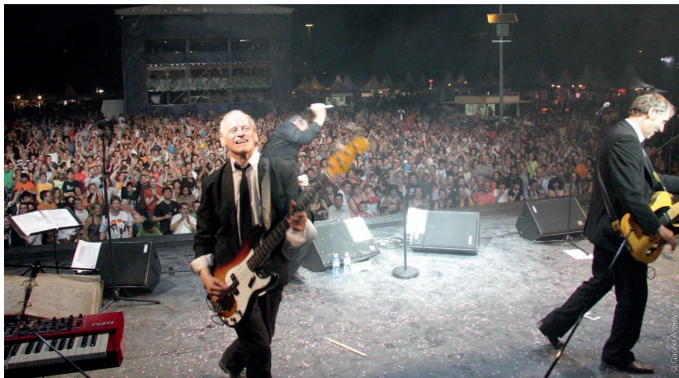
Le Beau Lac de Bâle allumera le feu vendredi 16 octobre aux Libellules.