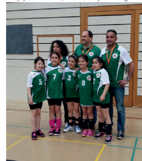
L'équipe U11 filles.