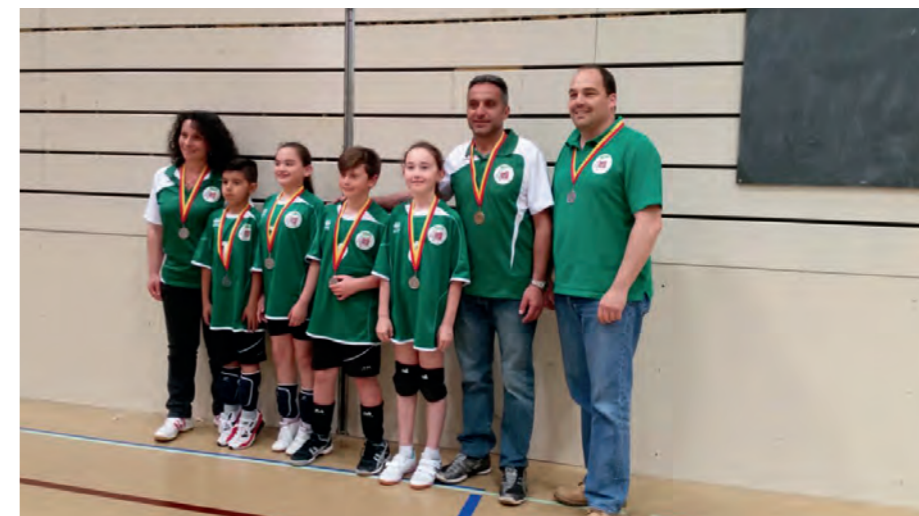
L'équipe U11 mixte, 2 e du championnats genevois.