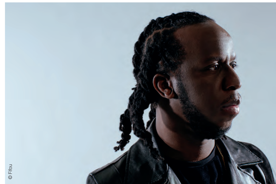
Youssoupha en concert vendredi 9 octobre à la Salle du Lignon.

Urban Express, un nouveau rendez-vous le samedi | Les jeunes de Vernier, justement, seront au cœur de cette édition. En plus de sa programmation principale, Vernier Sur Rock accueillera dans la journée du samedi Urban Express, un événement mettant en avant les cultures urbaines, porté par les associations locales Central Park et From Nothing. S'inscrivant pleinement dans la philosophie du festival, qui s'est toujours fait avec et pour les jeunes, le soutien à ce projet semblait naturel pour VSR. Démarche également appuyée par les Maisons de Quartier et des travailleurs