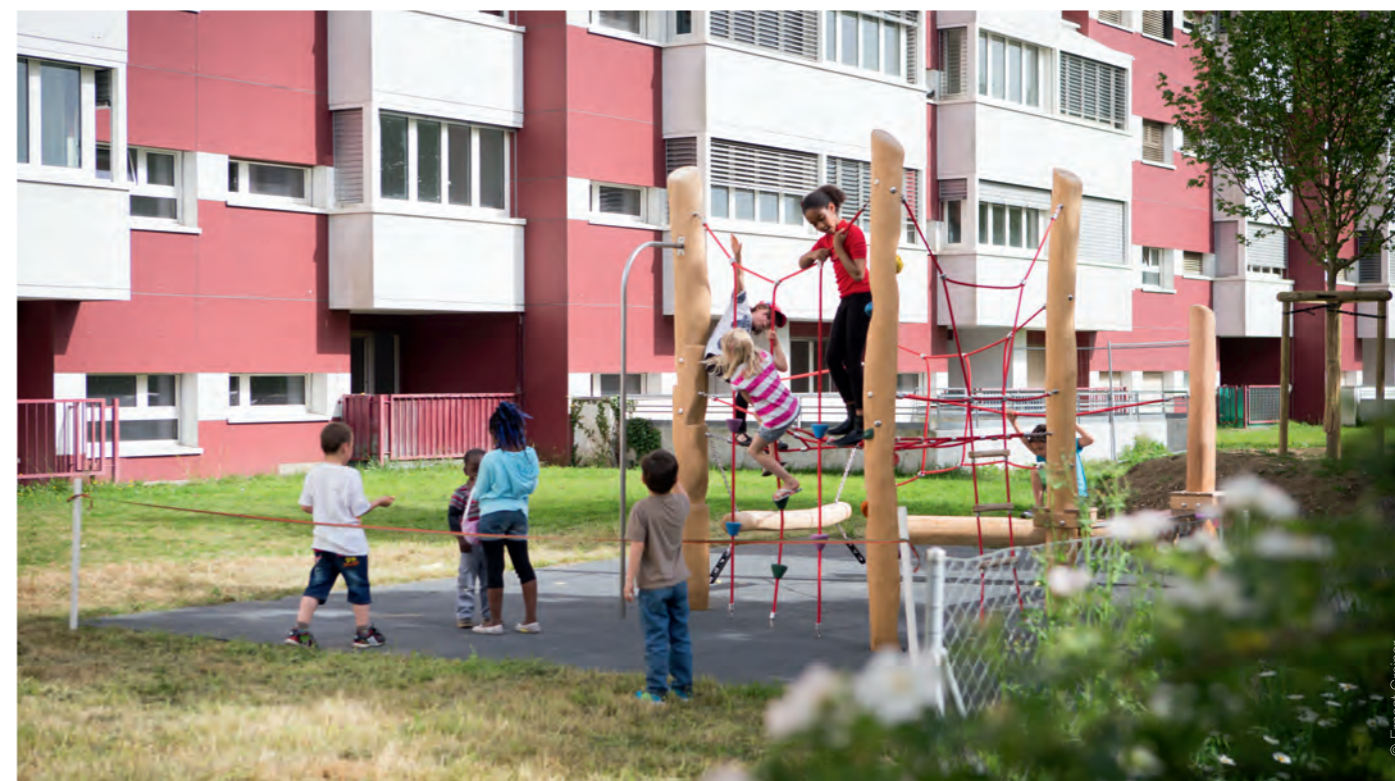
Espace de jeu.

l'association « From Nothing » notamment dans le but d'organiser des festivals de hip-hop dans le secteur et au-delà.