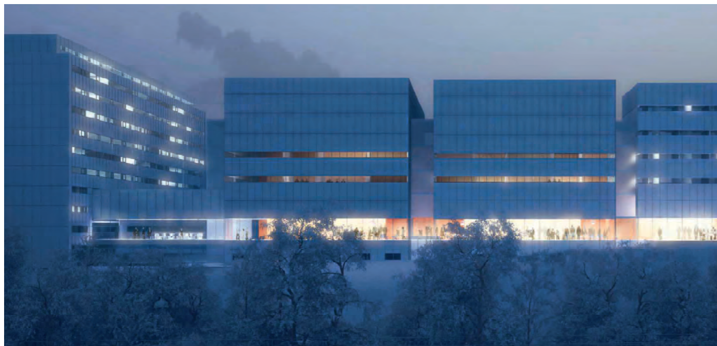
© Projet lauréat «ENTRE 1 VOIE VERTE», Luis Fidel Cámara Mamolar.

Exposition des projets au Pavillon SICLI du lundi 21 au samedi 26 septembre 2015 et du lundi 28 septembre au vendredi 2 octobre 2015.