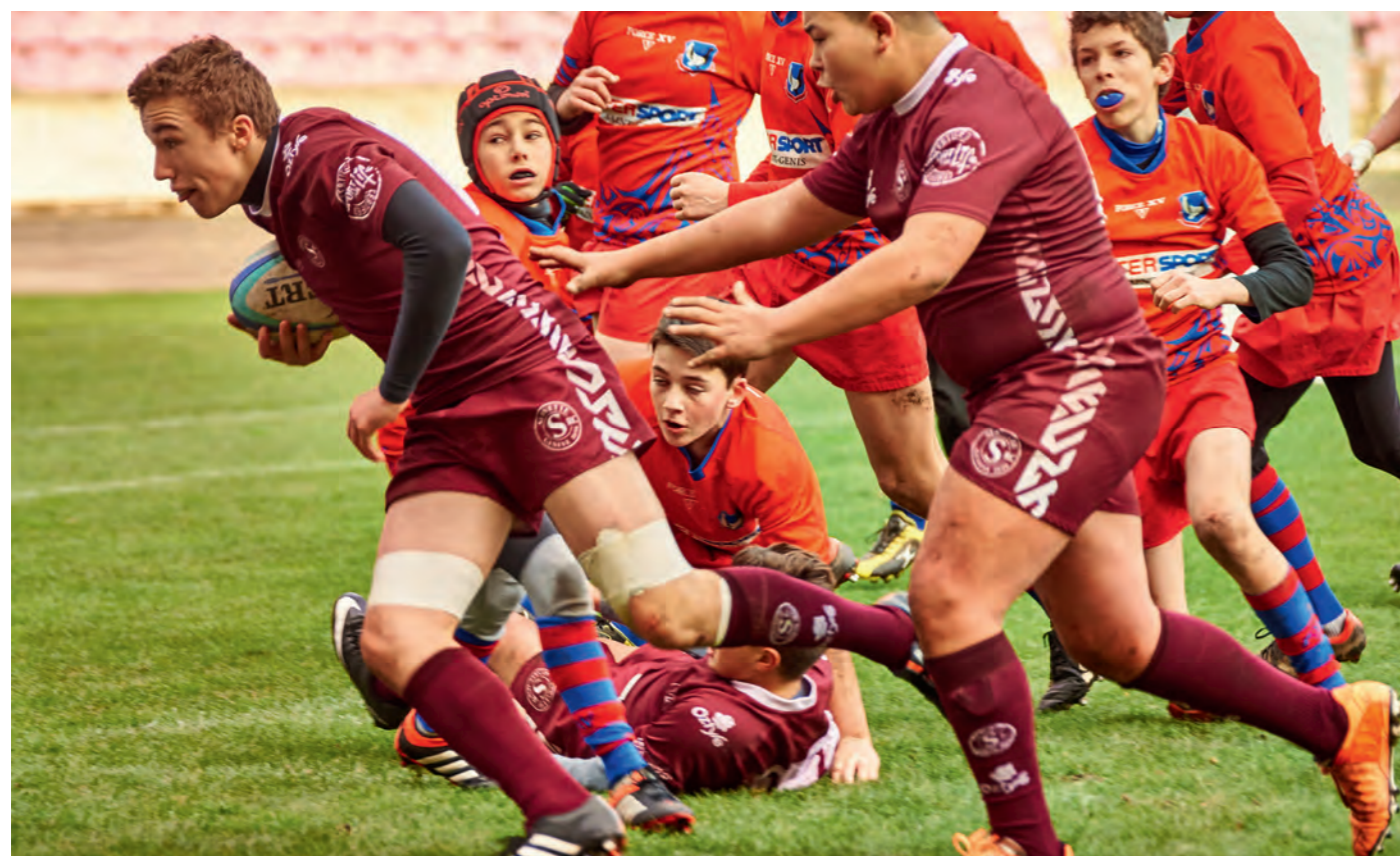
Les U14 du Servette Rugby Club de Genève en pleine action.

Pour tout renseignement, veuillez prendre contact avec le service des sports par téléphone au 022 306 07 70 ou par courriel à sports@vernier.ch .