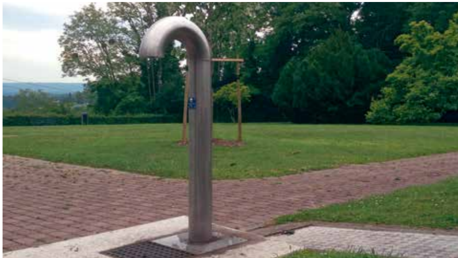
La fontaine de l'Esplanade: un des nombreux points d'eau potable publics de la Ville de Vernier.

L'eau, c'est la vie. Et par chance, elle coule à flot dans nos maisons. Elle provient en majeure partie du lac Léman (80%). Le solde (20%) est issu de nappes phréatiques locales. Aujourd'hui encore, son coût est minime, soit environ CHF 1,80 pour 1000 litres. Gérard Luyet, responsable de l'Activité eau potable aux Services industriels de Genève (SIG), répond à nos questions sur l'or bleu. Un bien précieux, qui prend encore plus de valeur durant la période estivale. Santé !