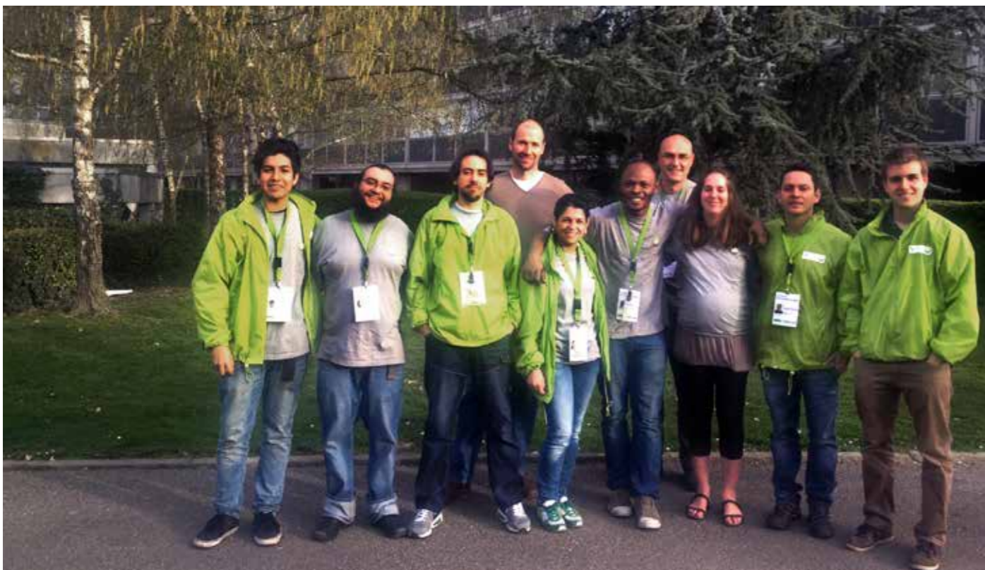
L'équipe des conseillers en énergie de l'opération « Une nouvelle lumière » au Lignon.

Après le quartier des Libellules, de Mouille-Galand et de Châtelaine, c'était au tour des habitants du Lignon de bénéficier des conseils pour leur permettre de réduire leur facture d'énergie. Avec 539 visites effectuées, l'opération « Le Lignon, une nouvelle lumière » est une belle réussite.