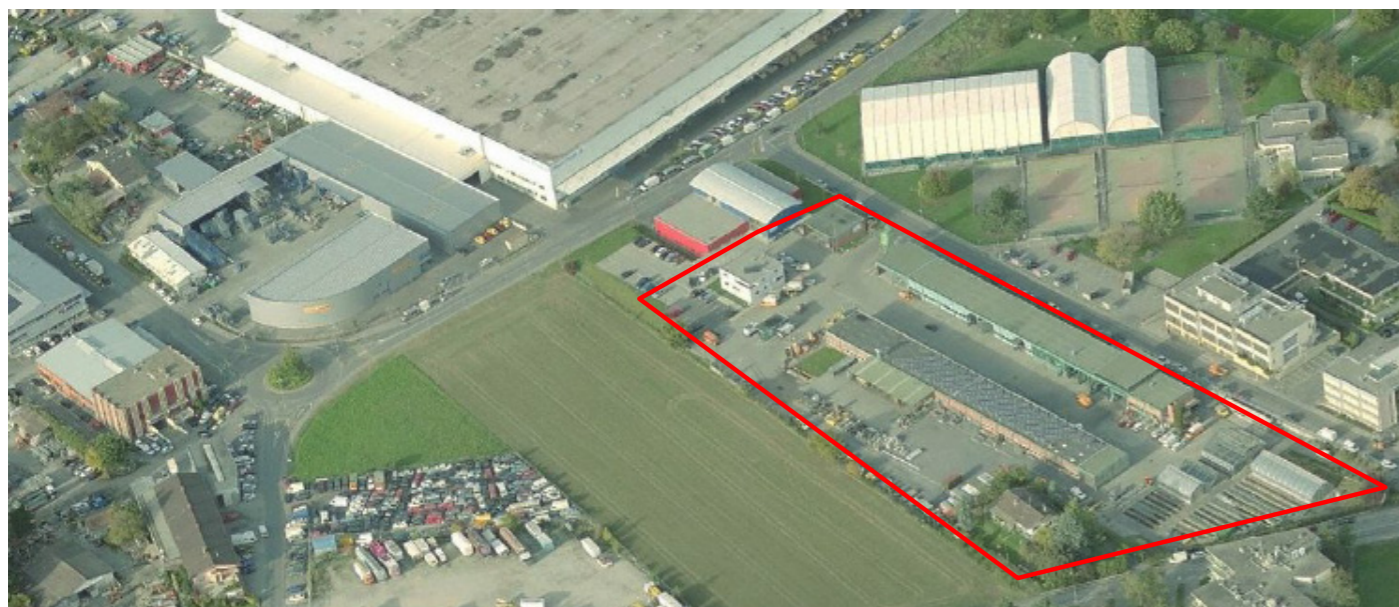
Périmètre concerné par le projet de salle multisports.

Dans la Tribune de Genève du 10 juin 2014 un article intitulé « Vernier souhaite un centre sportif à 100 millions » comportait certaines affirmations de nature à engendrer des confusions certaines. Le Conseil administratif tient à rectifier les erreurs que cet article contient.