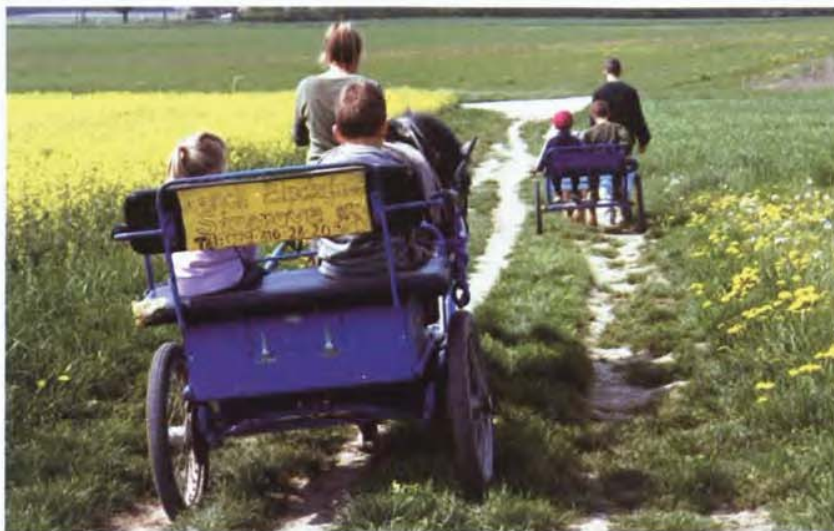
Le jardin d'enfants en sortie à la campagne

Plus précisément, la crèche des Avanchets s'adresse aux enfants de la naissance à 5 ans et offre 21 places à 100% et 7 places à 60% le matin. Le jardin d'enfants des Avanchets ne s'adresse lui qu'aux enfants dès l'âge de dix-huit mois. Il n'est pas ouvert entre 12h30 et 13h et dispose de 56 places à 50%. Les trois jardins d'enfants (Vernier, Châtelaine et Libellules) concernent les enfants âgés de 2 à 5 ans. En tout, ils comprennent 96 places à 40% «seulement». Ces lieux sont fermés entre 12h et 13h30. De