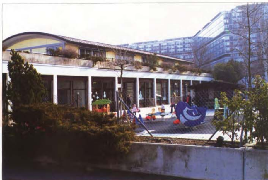
L'espace de vie infantile du Lignon s'adresse à tous les enfants dès la naissance

La municipalisation de la petite enfance est intervenue voici cinq ans déjà. Un premier bilan s'impose. Un certain nombre de places supplémentaires ont pu être créées. Mais surtout, l'offre globale est de meilleure qualité, les remplacements facilités, les locaux rénovés et les inscriptions sont regroupées. Notre dossier.