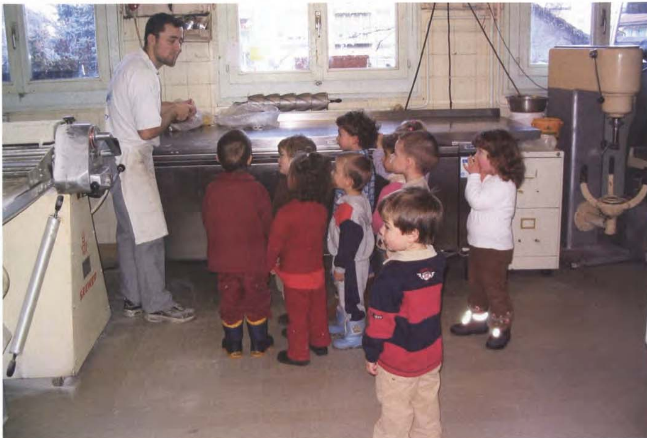
De nombreuses activités sont proposées aux petits fréquentant les jardins d'enfants : ici une visite à la boulangerie