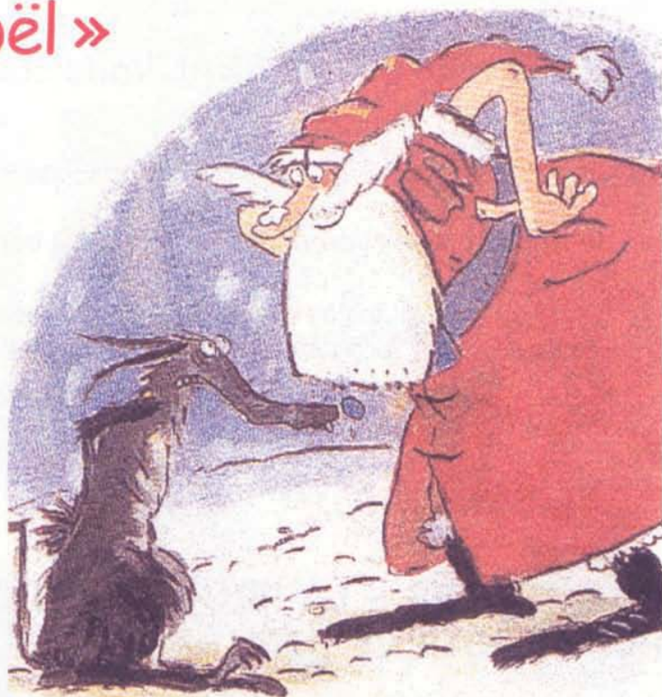
illustration de Claire Le Grand