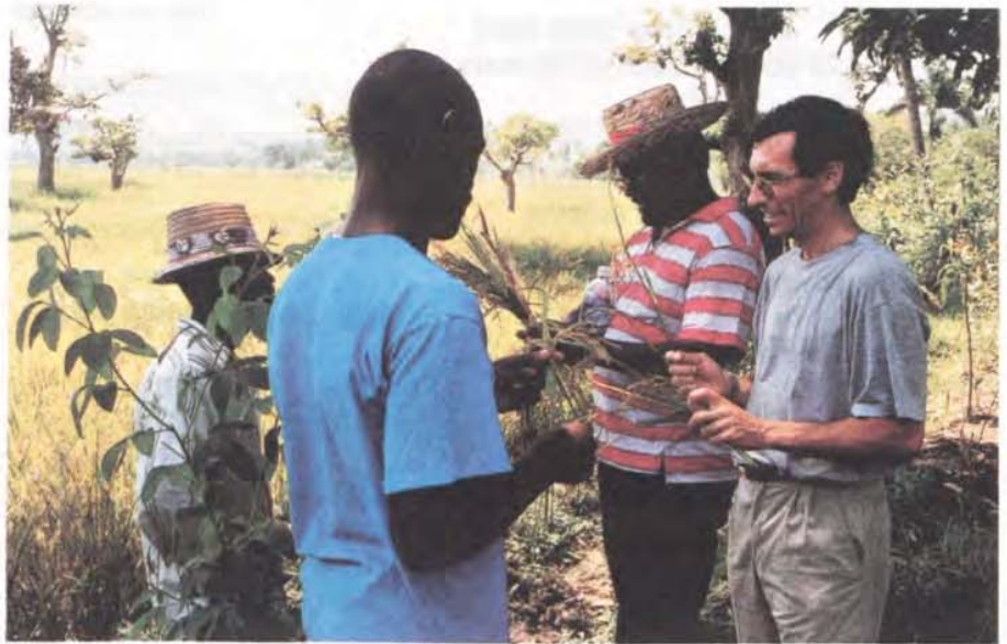
La Plaine d'Abraham

L'aide au développement apportée par la commune de Vernier n'est donc pas une simple «goutte d'eau dans l'océan» comme aiment à le dire parfois certains citoyens qui pensent que «notre argent pourrait être dépensé autrement»... Bien au contraire !