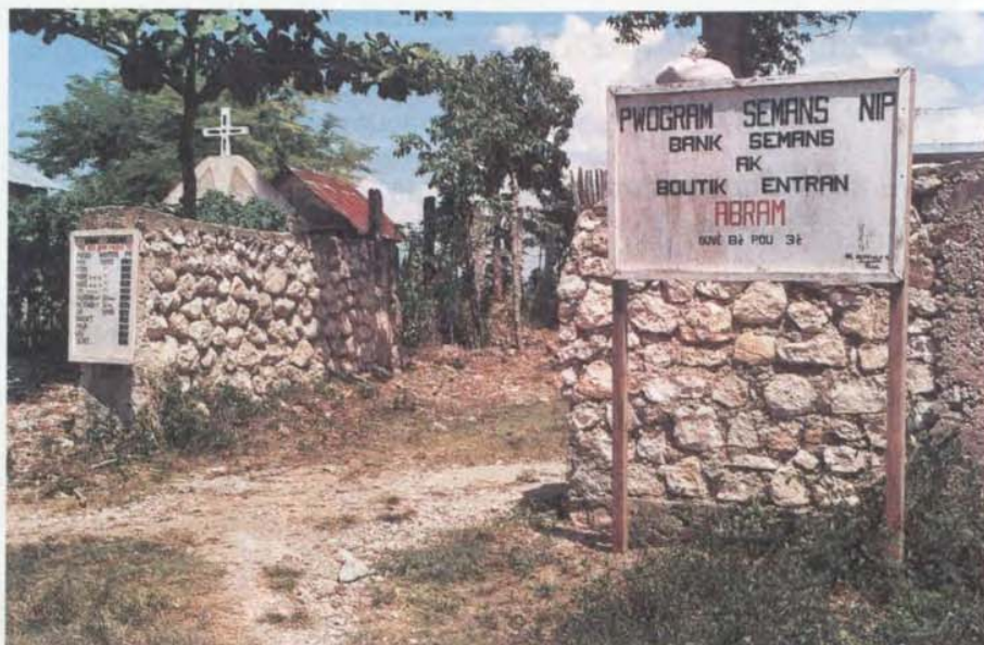
La boutique d'Abraham - Liste de prix affichés (à g.)

L'objectif du GRAMIR , de KOMBIT et de tous les acteurs impliqués dans ce programme est que le projet devienne autosuffisant et donc viable à long terme. Il s'agit de faire un bout de chemin ensemble, de partager et d'apprendre les uns des autres. En donnant un peu plus de quatre francs en deux ans, chaque Verniolan a contribué, sans même le savoir peut-être, à l'amélioration des conditions de vie de plusieurs milliers de personnes à l'autre bout de la terre. Que chacun en soit remercié !