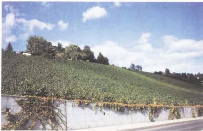
Photo n° 4 : un coin des vignes actuelles, sur le coteau au-dessus de l'entreprise Givaudan.