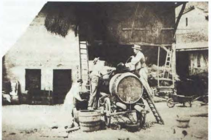
Photo n° 2, prêtée par Mme E. Pictet : " On est dans la cour de sa ferme "

La partie en bois du bâtiment n'a pas changé. Les supports de l'avant-toit, la barre horizontale, les portes et la fenêtre sont toujours là. Au centre de la photographie, tout à fait au fond, de l'autre côté de la rue, on distingue une embrasure de porte arrondie. De nos jours, la trace s'en voit encore.