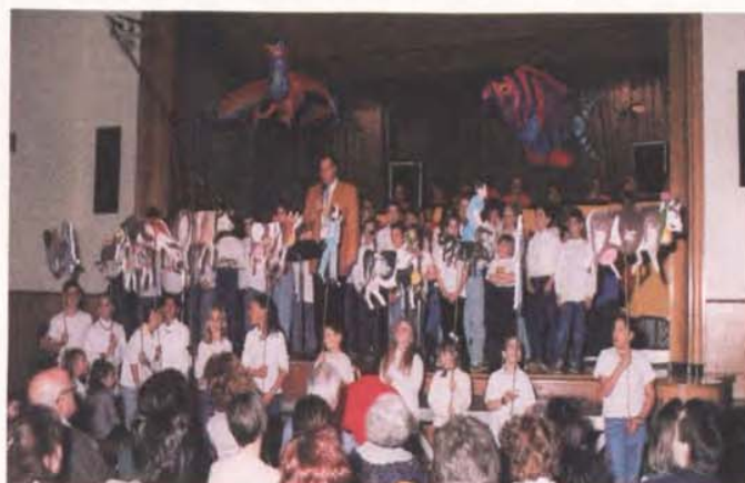
Le chœur d'enfants, régal de la soirée

Ce concert exceptionnel, d'une durée de 3 heures environ, sur le thème de Carnaval des Animaux, a connu une véritable réussite, grâce à la virtuosité des musiciens : ceux de la Fanfare, l'orchestre de son école de musique, la Fun-Phare, réunissant de tous jeunes élèves, et enfin le chœur d'enfants fort de 60 chanteurs, tous très à l'aise dans leurs interprétations. Dans ce succès, une mention spéciale doit être accordée à la décoration et aux costumes de scène, fruits d'un labeur juvénile enthousiaste.