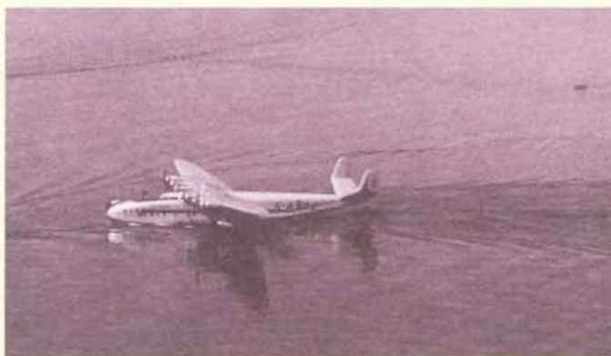
Le Latécoère 631 dans la rade de Genève (3)