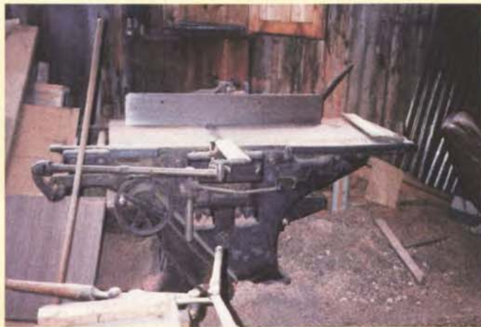
La vieille raboteuse des Frères Boddi