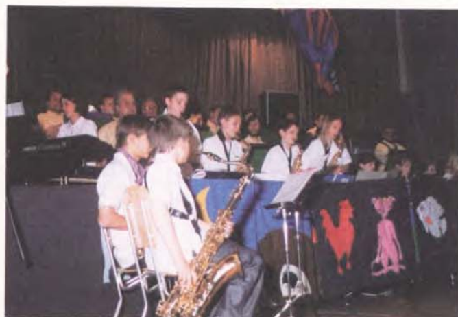
La valeur n'attend pas le nombre des années