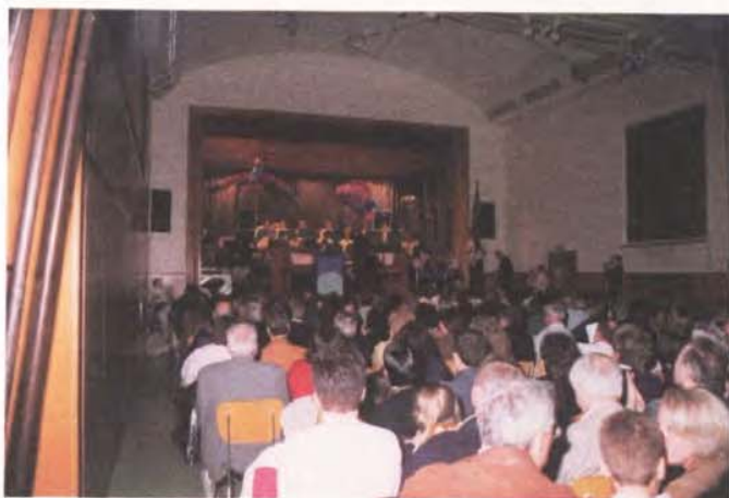
La Fanfare et les aînés, invités d'un soir

Le 14 avril, à la salle communale de Vernier-Place, la Fanfare municipale de Vernier a eu l'amabilité d'inviter les aînés de la commune à assister à son concert de printemps. Ils furent nombreux dans la salle (plus de 120) - et c'est tant mieux - auxquels il faut ajouter les parents et les amis des exécutants.