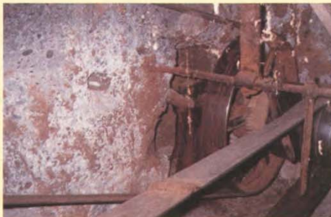
Les poulies et les courroies plates...