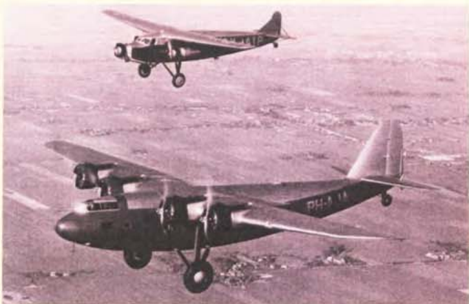
Avions Fokker de la KLM 1939 (4)