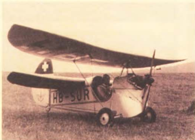
Un Pou-du-ciel, c'était ça (1)