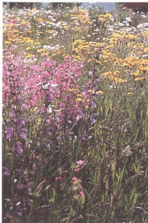
Exemple de prairie «Original CH»