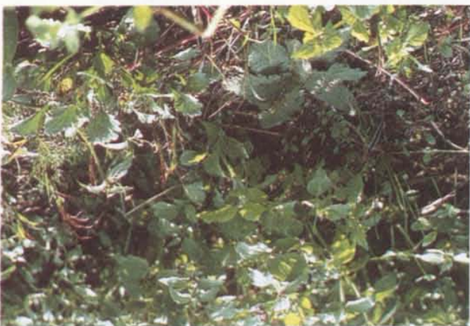
Aspect l'année du semis

Quant à la petite berme centrale du chemin de l'Etang (en face du garage Opel) une prairie de type flore «Ruderal CH» a été implantée.