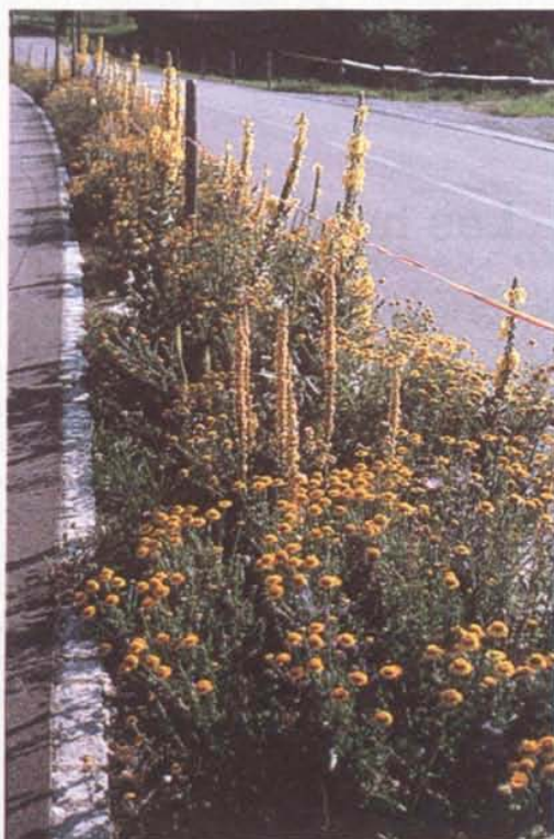
Berme centrale avec flore «Ruderal CH»