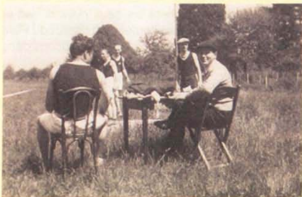
Etoile sportive / Concours 1935-36 - table de notation. Derrière l'école de Vernier-Place

ront droit au cours hivernal de culture physique, menaces de la Mairie qui supprimera le prêt de la salle si les dégâts continuent ce qui ne décourage pas le Société : elle réitère sa demande d'allocation qui sera finalement accordée (Fr. 100.-), pose d'un second panneau pour le basket et d'un " grillage pour protéger la lampe ", création de matchs d'entraînement pour juniors, tombola-volailles, choix d'un fanion, adoption de maillots obligatoires " aux couleurs noire et blan-