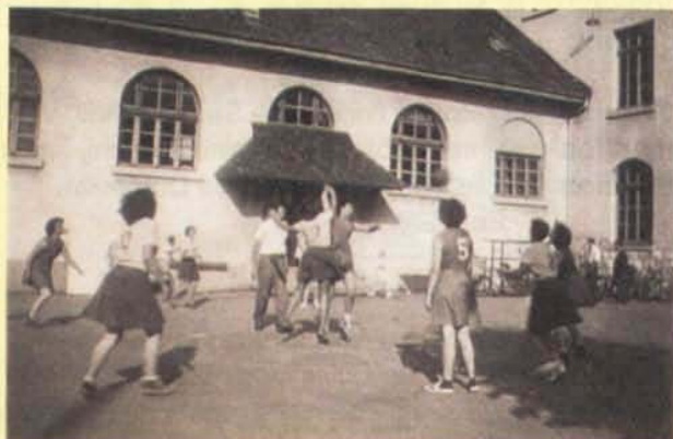
Etoile sportive féminine / 1950. Match de basket contre Hispano-Suïza / Ecole de Vernier-Place avant agrandissement.