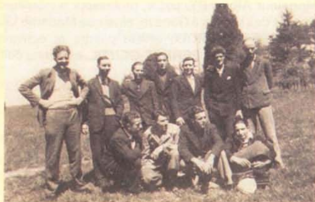
ES 1935-36 / après le concours