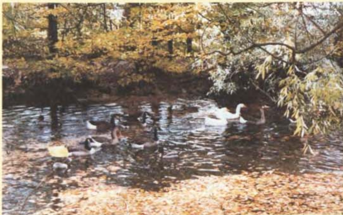
L'automne sur l'étang

La pinède des Moulins ? On y a une assez belle vue sur l'autoroute. Les nants d'Avanchet, des Grebattes, de la Noire ? Passons. Restent les bords du Rhône. Jusqu'à quand ?