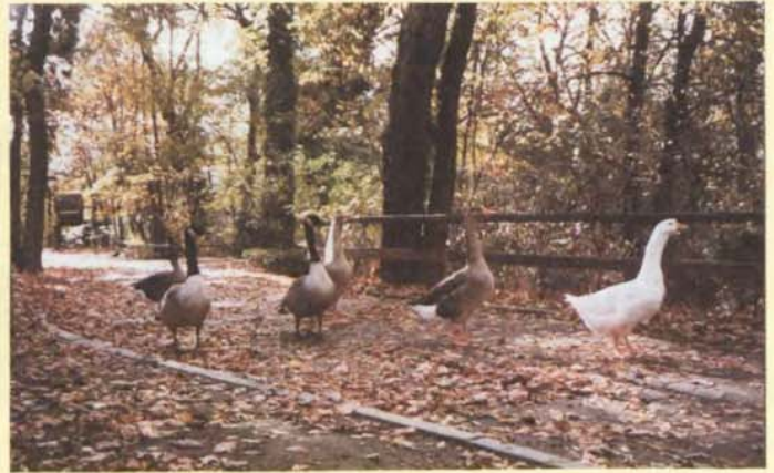
Les oies sont chez elles...

qui gelait pour la plus grande joie des gamins patineurs, n'existent plus. Le marais de Morglas a vécu et avec lui les petits chemins d'autrefois. La nouvelle route et le giratoire ont tout dévoré, à la grande satisfaction de la circulation automobile.