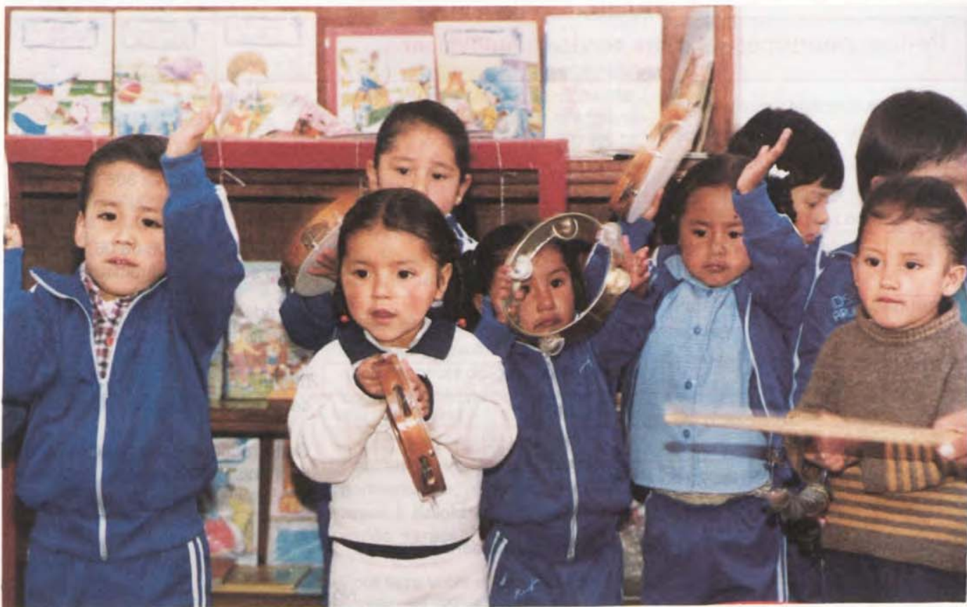
Un atelier de rythmique à Pukllasunchis. Apprentissage et jeu vont de pair.