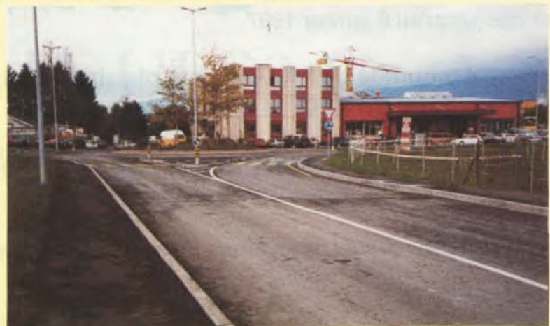
Là se trouvait la gouille de Morglas