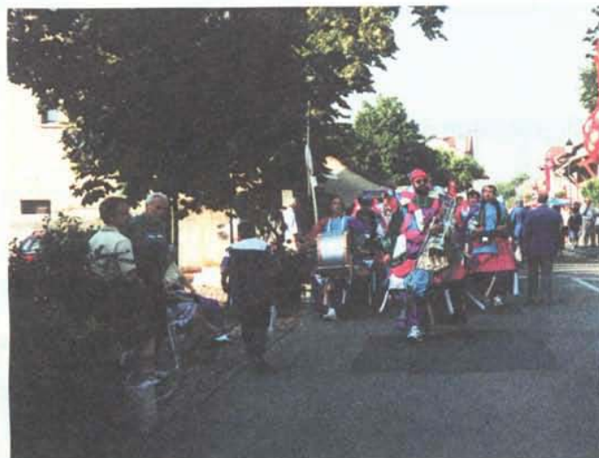
Le "Loitchou's Band" de Saignelégier