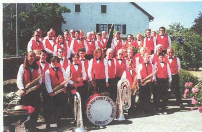
La Fanfare de Sergy "Echo du Crêt de la Neige"