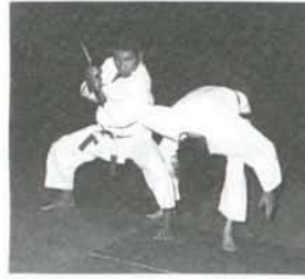
Aikido Lundi 20h30 Mercredi 19h15