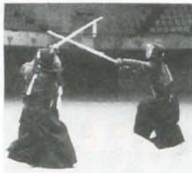
Kendo Lundi 18h00 Vendredi 18h30