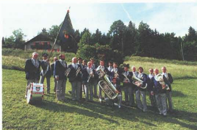
La Fanfare municipale de Vernier