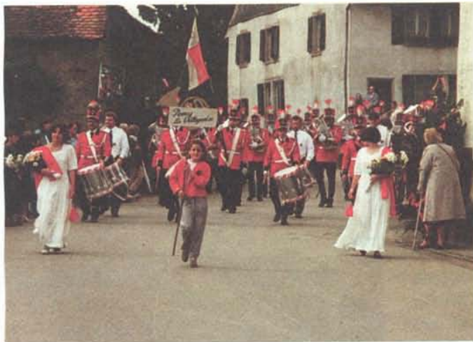
La Fanfare de Pomy "La Villageoise"