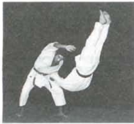
Judo Lundi 19h15 Mercredi 18h00