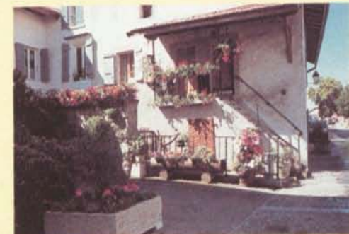
Une courette bien fleurie