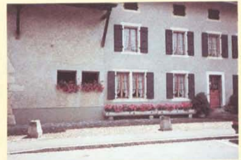
Les auges fleuries