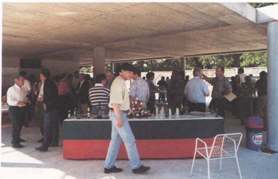
Le bouquet du chantier du bassin couvert a eu lieu le 6 juin 1996.