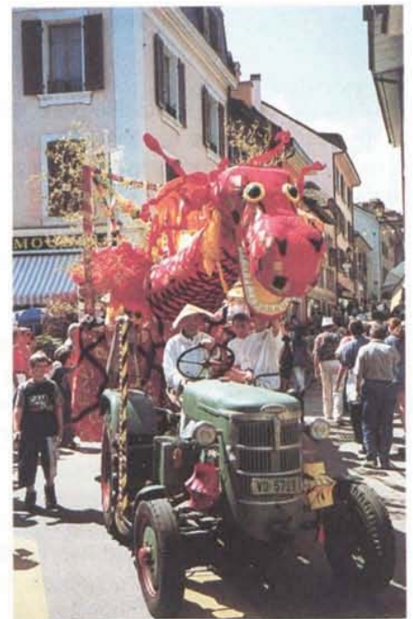
La «Bête» de l'Avenir

BIEN et en catégorie Moyen-seniors, ils décrochent la mention EXCELLENT. Voilà des résultats qui font plaisir. Bravo à tous !