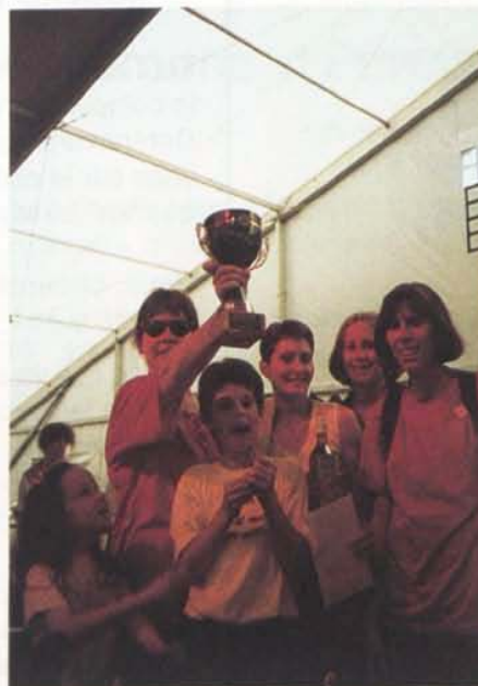
Oh, la belle coupe !

Pendant que l'équipe «Dragon» s'affaire au montage, nos musiciens y vont gaiement : dans la catégorie Facile-juniors, ils sortent la mention