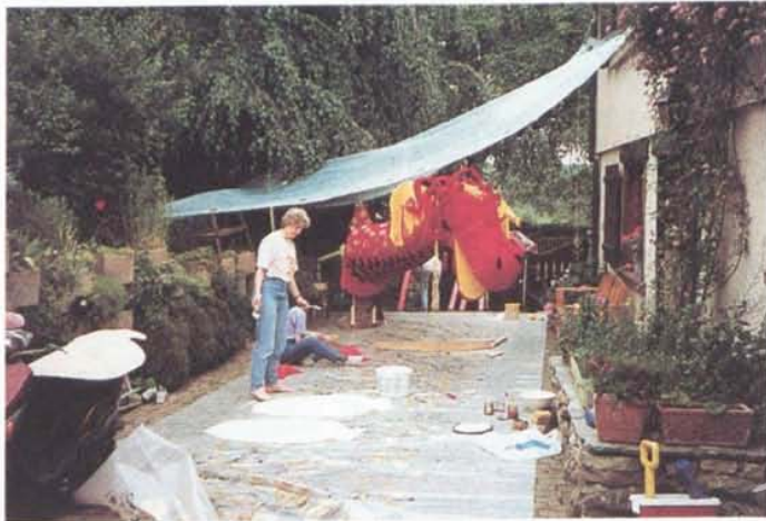
"Montons sous la pluie..."

Après le concours de Prilly du début mai, nous voici de nouveau sur la brèche ! Il s'agit de défendre les couleurs de la Commune... et les nôtres à Nyon, à l'occasion de la 12e Fête fédérale des Accordéonistes qui, pour la première fois de son histoire, se tient en Suisse romande. Il faudra