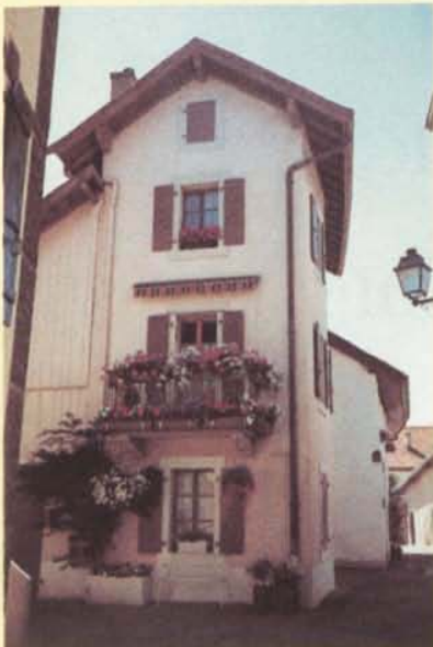
Cette maison tout en hauteur

Nous passions de géraniums en pétunias, de catalpas en tilleuls fleuris lorsque l'un d'entre nous fit remarquer que, pour la beauté de l'ensemble, nous n'avions rien à envier à ces villages du Midi que l'on se plaît à visiter aux vacances. Et il est vrai que, sous certains angles, il y a chez nous des coins qui rappellent la Provence, l'Italie, le Tessin.