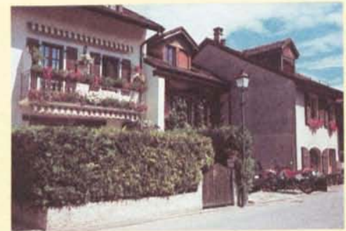
Un si joli balcon...