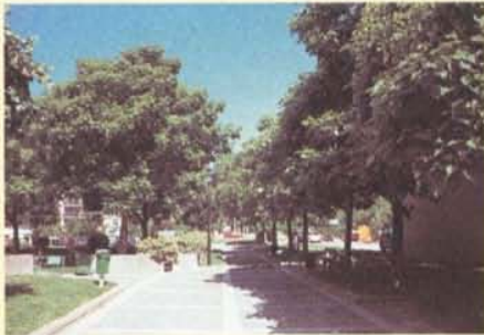
Les catalpas de l'allée

Il y a quelque temps, nous traversions le Village au gros de la chaleur de juin. Quelques amis des bords de la Méditerranée nous accompagnaient et admiraient les décorations florales qui émaillent fenêtres, caisses, balcons ou encadrements.