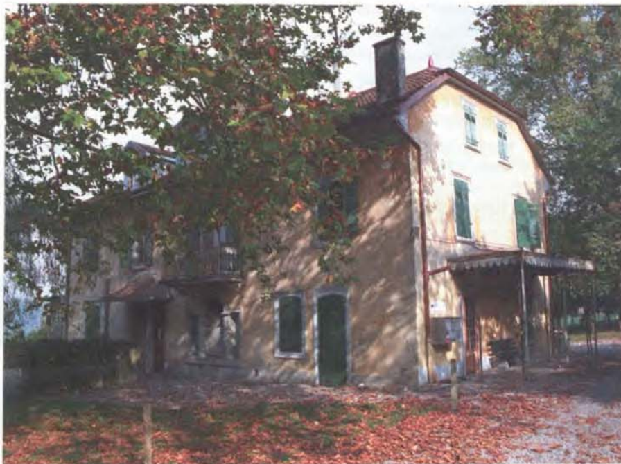
Le bâtiment du Vieux-Lignon