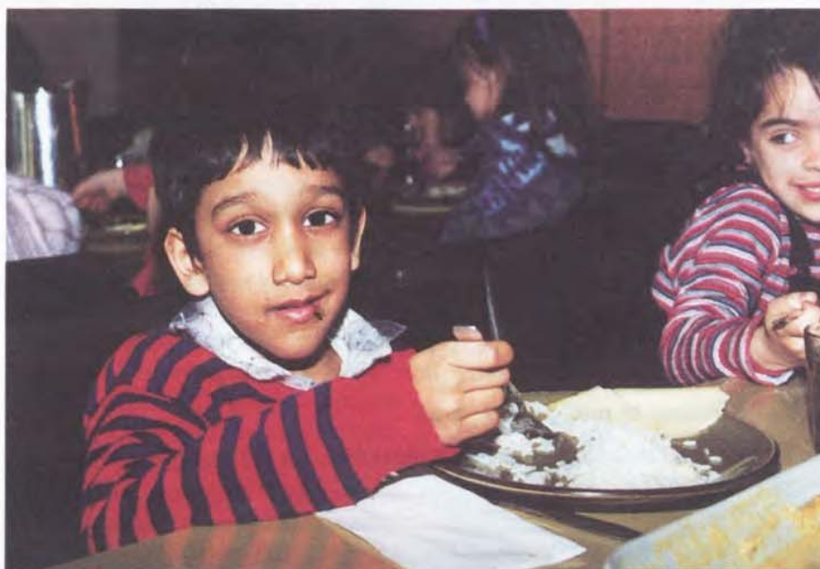
Repas au Restaurant scolaire de l'école d'Avanchet

Y a-t-il une alimentation spécifique pour les enfants ? Que faut-il leur donner à manger pour le goûter ?