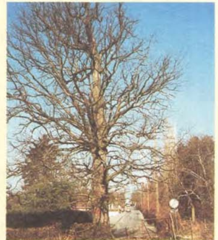
La Greube et le gros chêne