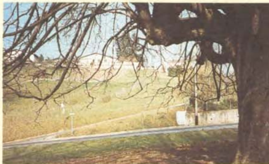
Le marronnier des Pichonnaz et le Progrès

Le froid piquant et la neige récente nous ont remis en mémoire les «bonnes lugées» qu'enfants, nous pratiquions «à Souvayère» comme nous le disions alors. Pour être plus pro-