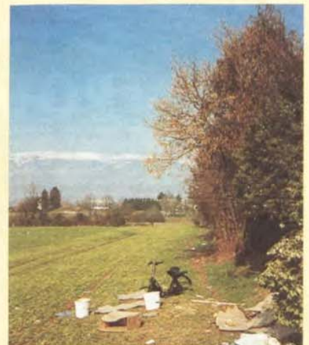
Un petit sentier qui meurt...