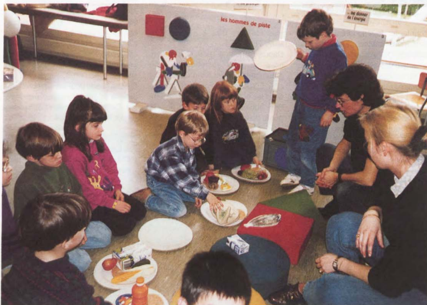
L'exposition "Le cirque des aliments" fait participer les enfants