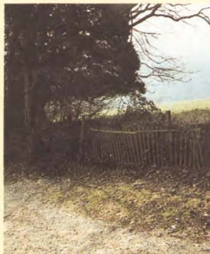
Chemin de la Grille; Sous Vallière; Loëx

et froid qui barrait l'horizon, le lieu paraissait sévère, mais on faisait avec. Avec la neige de cet hiver, les nouveaux habitants de Vernier ont retrouvé en partie le chemin des écoliers, mais probablement pas les bons