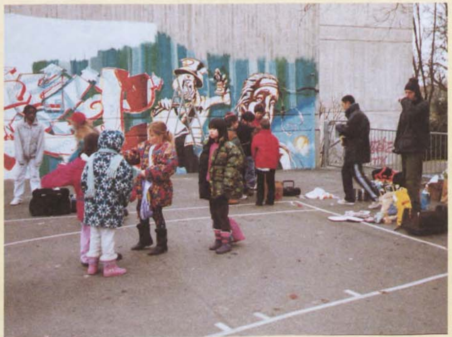
"Une fresque intelligente voyait le jour"

Le Comité de l'AIVV qui souhaite à tous une bonne et heureuse année.