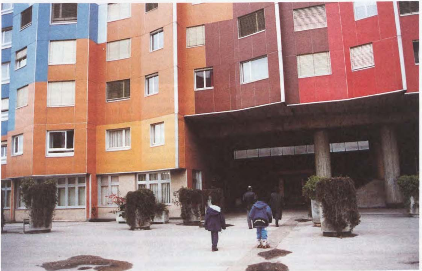
Le centre social des Avanchets

Pendant la période concernée, on dénombre 262 nouveaux dossiers (pour les consultations de couple, l'interlocuteur privilégié sera considéré comme un consultant, s'il s'agit de deux demandes distinctes, on comptera deux consultants). Parmi ceux-ci, on dénombre 166 femmes et 96 hommes. Le nombre de consultants suisses et étrangers est quasiment identique : il y a 123 Suisses et 138 étrangers. La plupart sont mariés (119) ou célibataires (59) ou encore divorcés (59). Dans 127 cas, il s'agit de consultants vivant au sein d'un ménage de trois personnes et plus. Concernant leur statut professionnel, il s'agit fréquemment de salariés sans fonction dirigeante (78), de rentiers (68) ou de chômeurs (59). La plupart n'étaient pas connus du Service social (176 sur 262), le premier pas est généralement le fait du consultant lui-même. Rares sont les cas où l'indi-