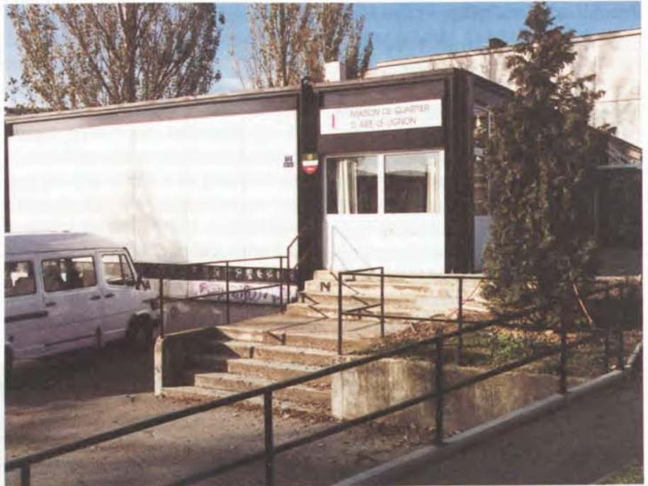
La Maison de quartier d'Aire-Le Lignon où se tient la Permanence chômage

Parallèlement au travail effectué par le Service social communal, trois équipes de l'Hospice Général s'activent : au Lignon (trois assistantes sociales et une secrétaire sociale),