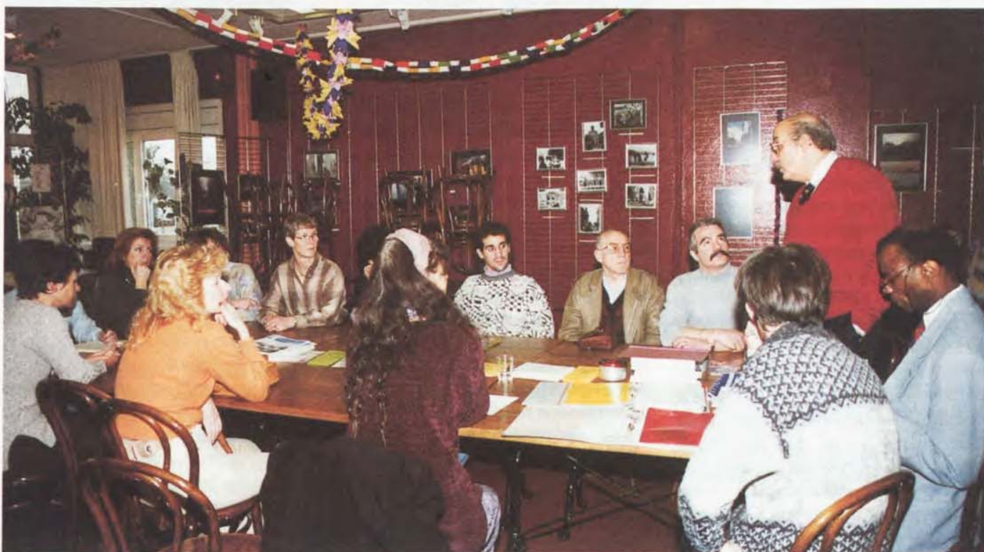
La Permanence chômage, un lieu d'échange

Outre les informations qu'il détient sur les divers organismes où l'on trouve des logements aux meilleurs prix, le Service social écrit un certain nombre de lettres de soutien lorsque la personne a besoin d'être recommandée auprès d'une régie ou une lettre de présentation de la personne auprès des organismes sociaux afin de gagner du temps.