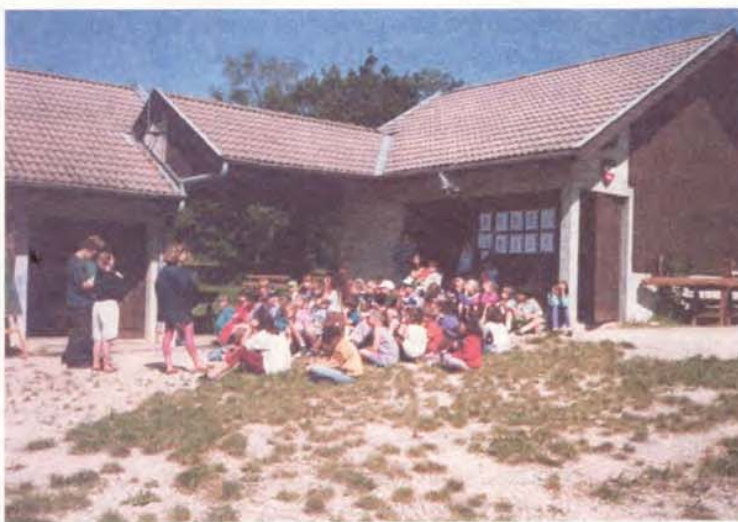
Début de journée au camp de Frangy

met sa salle disco à la disposition des parents et des enfants pour la réalisation de cette fête, les mercredis de 15h30 à 18h30, au prix de fr. 20.- pour la salle ou fr. 40.- pour la salle avec une animation musicale et jeux.