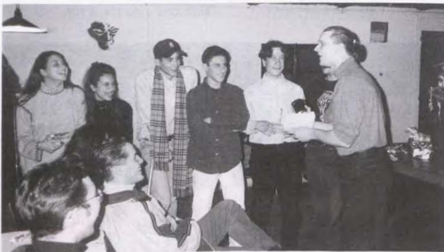
Les habitués de l'ABARC

ABARC, route de Vernier 151, 1214 Vernier Tél. 796 21 01 - CCP 12-6902-0