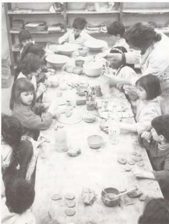
L'atelier de poterie

Le secteur «pré-ados» regroupe un certain nombre de propositions pour les 10-13 ans dont le dénominateur commun est l'accueil. Chaque jour