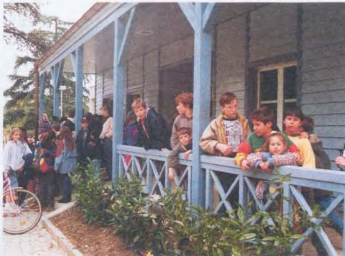
Le nouveau bâtiment de Balaxert

mercredi midi. Les jours de congé (mercredi et samedi après-midi), les enfants peuvent en outre opter pour deux ateliers, activités spécifiques encadrées et suivies.