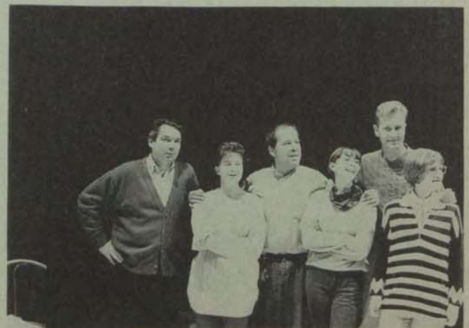
Les comédiens en répétition