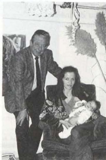
Les nouveau-nés avec leur mère et leur maire