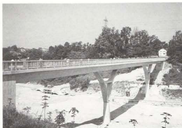
Passerelle «piétons et deux roues» du Bois-de-la-Grille

La passerelle dégage dans son ensemble une impression de légèreté. L'aspect est agrémenté par des lignes aux couleurs de la Commune de Vernier constituées par des carrelages collés sur la tranche des piles. Les culées sont situées dans des talus arborisés.