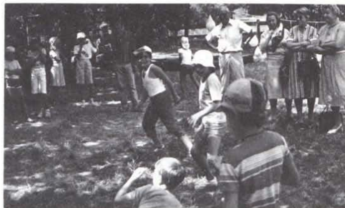
Au Centre aéré à Frangy (août 84)

En 1958, un Service social communal moderne est créé. Son but n'est plus seulement l'aide urgente en cas de difficultés, c'est un service à toute la population dans les domaines les plus divers.